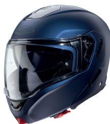
Blu opaco Yama