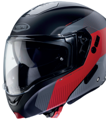
Horus Scout Nero opaco/Rosso/ Antracite/Argento

HORUS è l'apribile Caberg pensato sia per il Touring ma anche per l'utilizzo urbano grazie alla doppia omologazione P/J che permette l'utilizzo sia con mentoniera aperta (configurazione J) sia con mentoniera chiusa (configurazione P) superando i test omologativi previsti dalla normativa Ece 22.05 P/J.