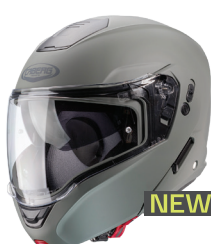
Grigio opaco Kamo