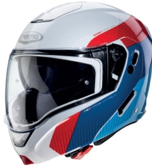
Horus Scout Bianco metallizzato/ Rosso/Blu/Azzurro