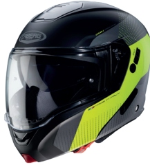
Horus Scout Nero opaco/Giallo Fluo/ Antracite/Argento