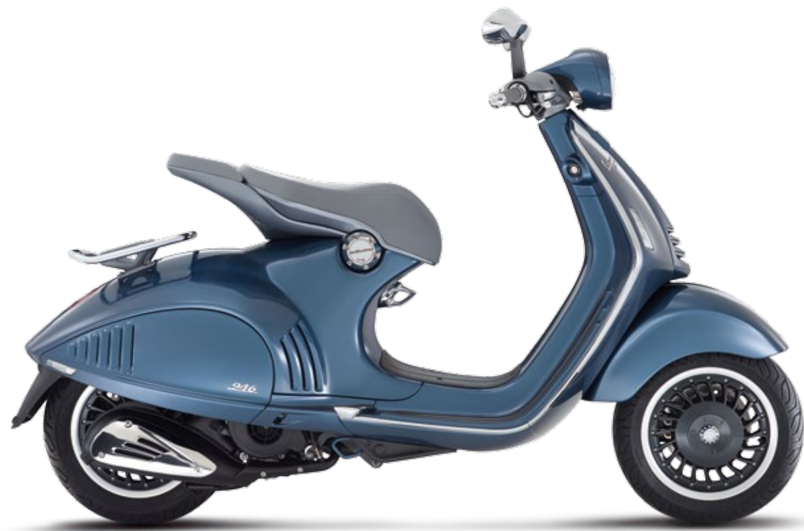
M E T A L L I C B L U E