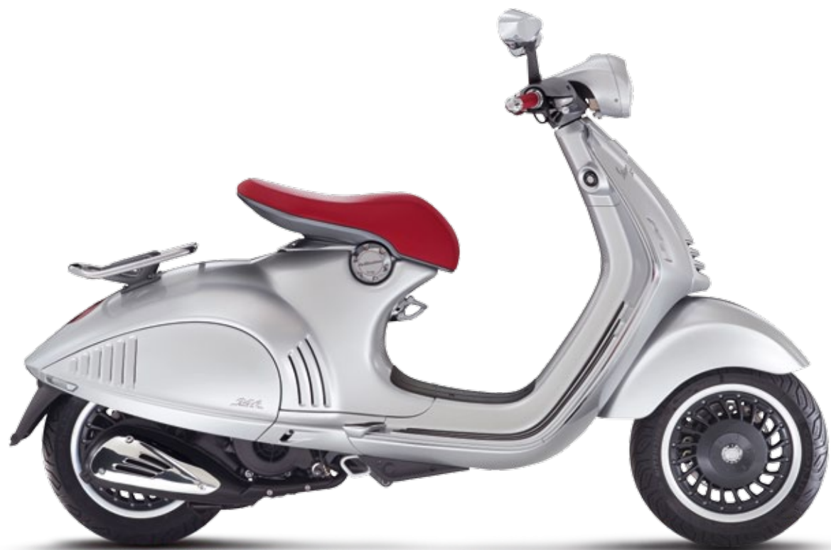
M E T A L L I C G R E Y