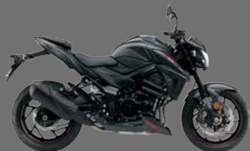
Nero Mat Metallico