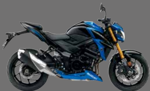
Nero / Blu