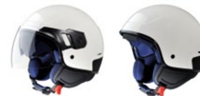
• Casco PJ e PJ1