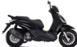
NERO OPACO CARBONIO