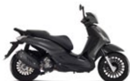
GRIGIO OPACO NEBULOSA