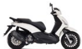
BIANCO STELLA (125 cc)