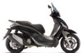
NERO OPACO CARBONIO