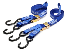
Cinghie con chiusura a fibbia Yamaha

Per tutti gli Accessori YZ250F visita il sito www.yamaha-motor.it/accessori oppure un Concessionario Ufficiale Yamaha.