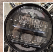
Faro a led