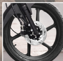
Cerchi in alluminio