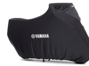
Telo di copertura Yamaha per rimessaggio interno