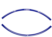
Adesivi per cerchi da 17"