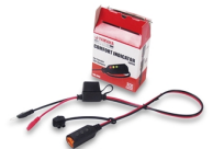
Indicatore caricabatteria YEC

Per tutti gli Accessori YZF-R125 / ABS visita il sito www.yamaha-motor.it/accessori oppure un Concessionario Ufficiale Yamaha.