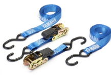
Cinghie con cricchetto Yamaha