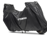
Telo di copertura per modello Yamaha da esterno