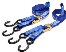
Cinghie con chiusura a fibbia Yamaha