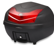
Bauletto City da 39 l