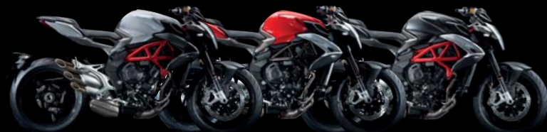
BIANCO ICE PERLATO/GRAFITE MET. OPACO