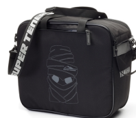
Borsa interna per borse laterali Super Ténéré