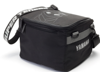
Borsa interna per bauletto in alluminio Super Ténéré