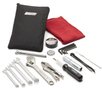
Kit degli attrezzi (metrico)