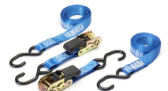
Cinghie con cricchetto Yamaha

Per tutti gli Accessori WR450F visita il sito www.yamaha-motor.it/accessori oppure un Concessionario Ufficiale Yamaha.