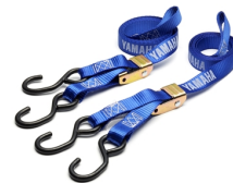
Cinghie con chiusura a fibbia Yamaha