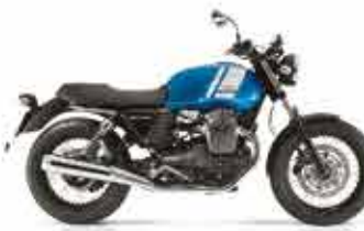
V7II SPECIAL Azzurro Essetre