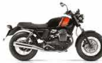
V7II SPECIAL Nero Essetre