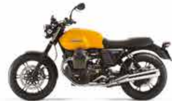
V7II STONE Giallo Denso

* Peso con moto pronta all'uso, con tutti i liquidi di esercizio, senza carburante.