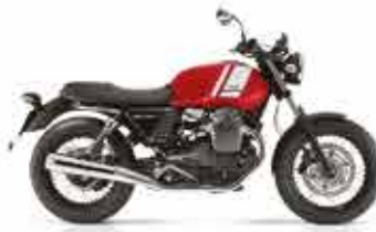
V7II SPECIAL Rosso Essetre