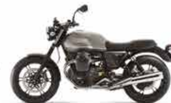
V7II STONE Grigio Intenso