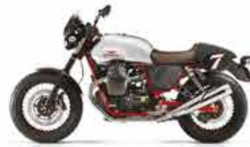
V7II RACER Racer