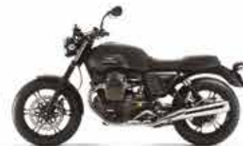
V7II STONE Nero Ruvido