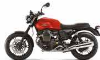
V7II STONE Rosso Impetuoso