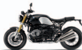
Black Storm metallizzato Condizioni di consegna: Sella passeggero montata, telaietto passeggero montato

* BMW non risponde della garanzia per modifiche alla nineT, oltre quelle previste dagli accessori originali. La responsabilità prodotto è limitata allo stato originale della moto. Modifiche tecniche che influiscono sull'omologazione si devono valutare in base alle normative di legge locali. In alternativa, è possibile richiedere all'autorità competente l'accettazione come esemplare unico per la circolazione su strada.