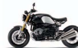
Black Storm metallizzato (non omologabile*): Sella passeggero smontata, telaietto passeggero smontato, portatariga con luce posteriore e indicatori di direzione smontati, estremità del telaio posteriore smontata, supporto scarico (accessorio) montato. Customizzazione non BMW.