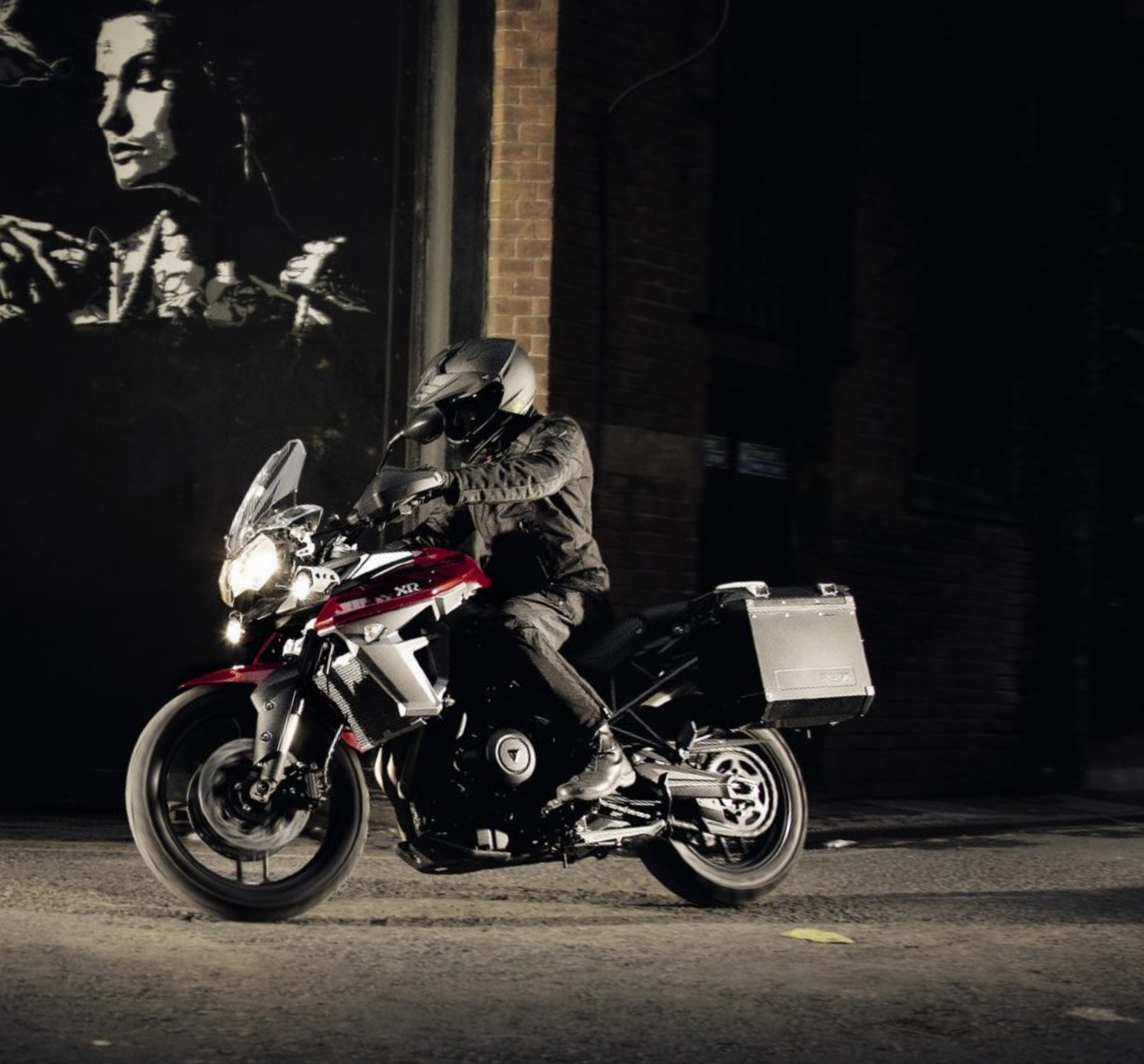
MODELLO RAFFIGURATO: TIGER 800 XRT