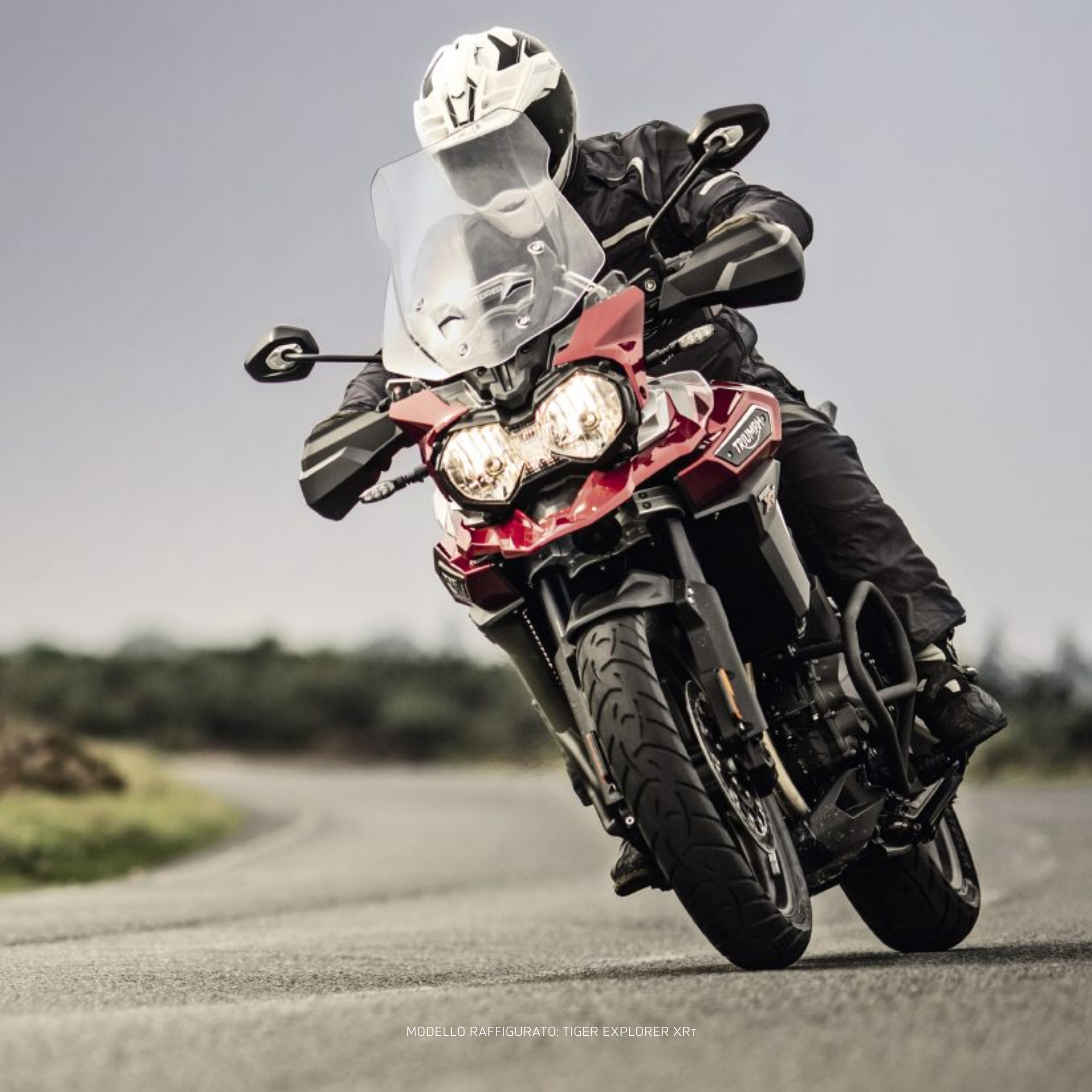
MODELLO RAFFIGURATO: TIGER EXPLORER XRT