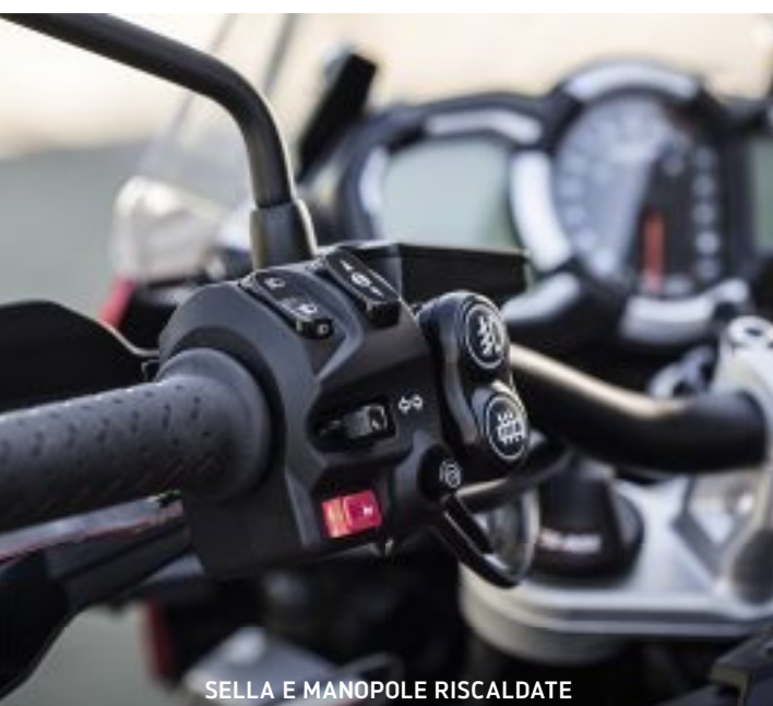
SELLA E MANOPOLE RISCALDATE