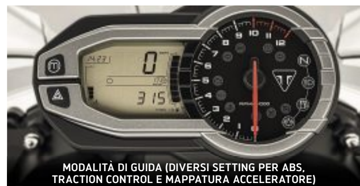
MODALITÀ DI GUIDA (DIVERSI SETTING PER ABS, TRACTION CONTROL E MAPPATURA ACCELERATORE)