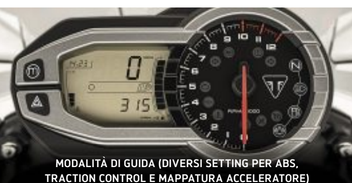
MODALITÀ DI GUIDA (DIVERSI SETTING PER ABS, TRACTION CONTROL E MAPPATURA ACCELERATORE)