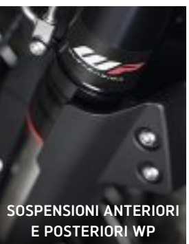
SOSPENSIONI ANTERIORI E POSTERIORI WP