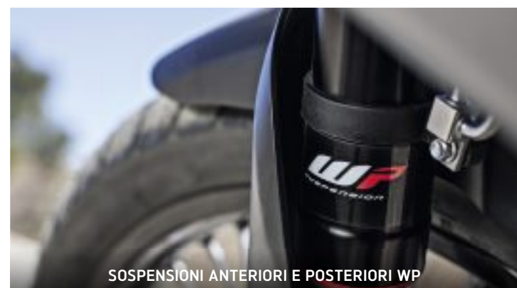
SOSPENSIONI ANTERIORI E POSTERIORI WP