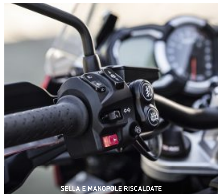
SELLA E MANOPOLE RISCALDATE