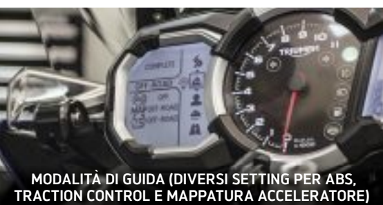
MODALITÀ DI GUIDA (DIVERSI SETTING PER ABS, TRACTION CONTROL E MAPPATURA ACCELERATORE)