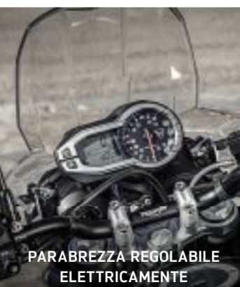
PARABREZZA REGOLABILE ELETTRICAMENTE