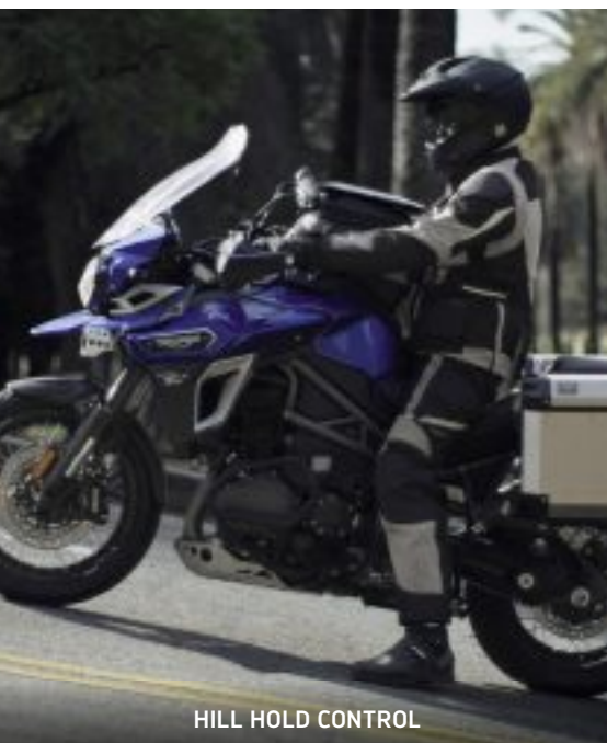
HILL HOLD CONTROL