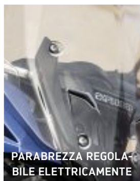
PARABREZZA REGOLABILE ELETTRICAMENTE