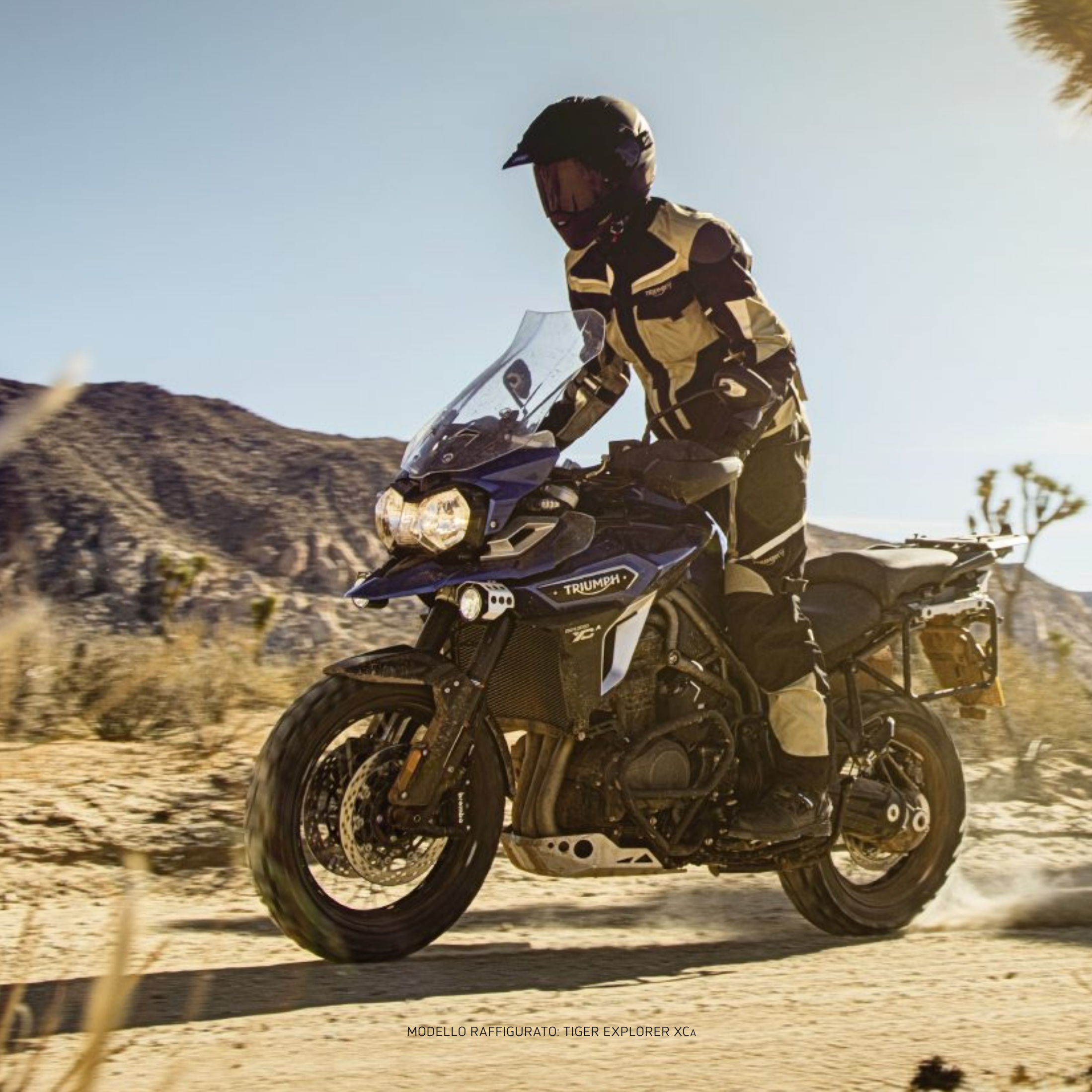
MODELLO RAFFIGURATO: TIGER EXPLORER XCA