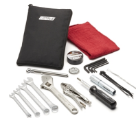
Kit degli attrezzi (metrico)