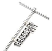
Set cacciavite a T scorrevole Yamaha

Per tutti gli Accessori TT-R110E visita il sito www.yamaha-motor.it/accessori oppure un Concessionario Ufficiale Yamaha.