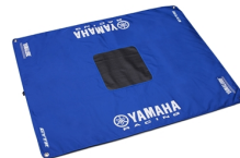
Tappetino da lavoro Yamaha Off-road