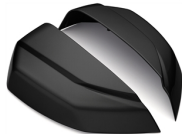
Pannelli del coperchio colorati per bauletto da 50 l