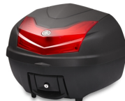
Bauletto City da 39 l