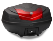
Bauletto City da 50 l