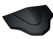
Pannelli del coperchio colorati per Bauletto da 39 l