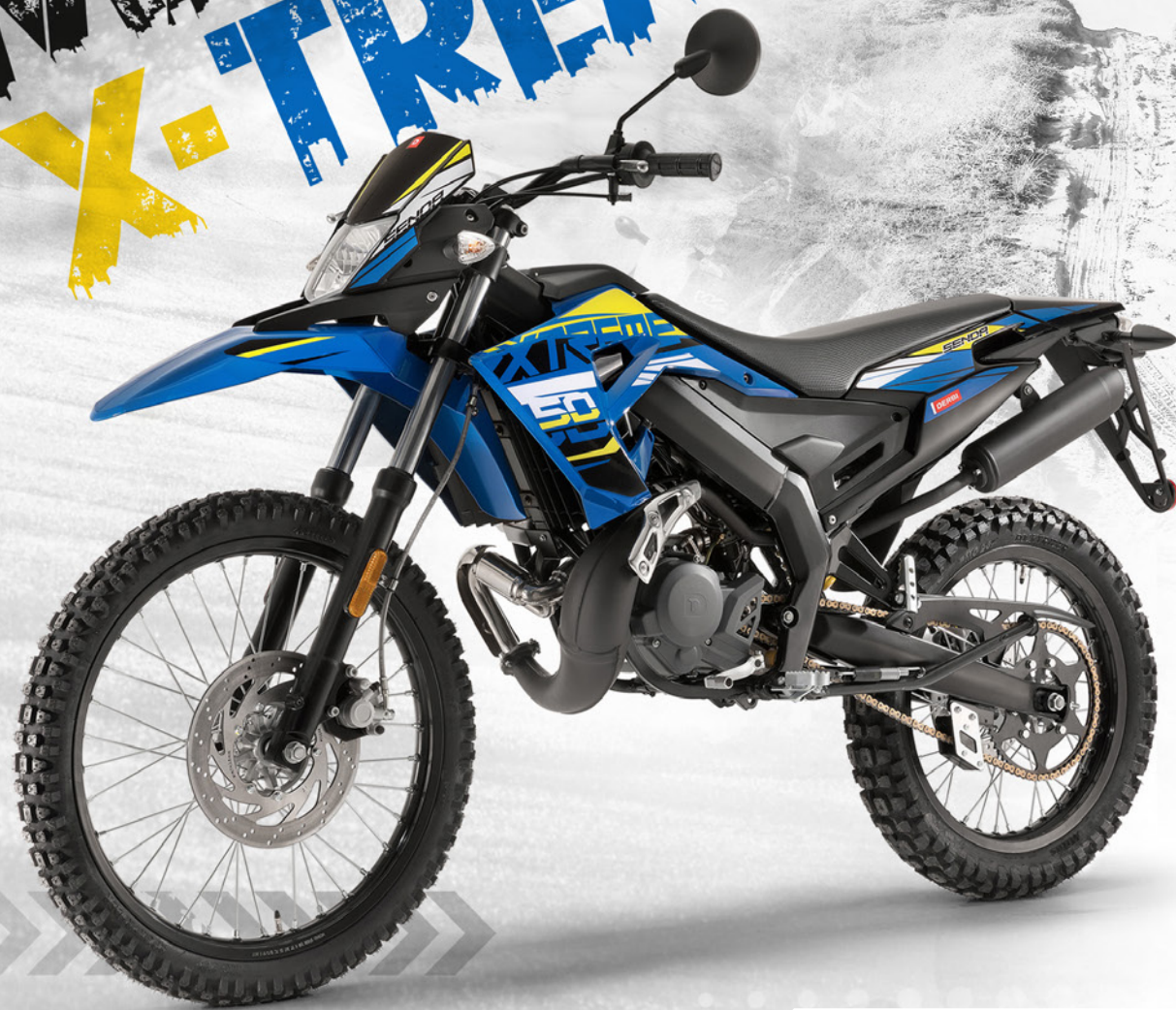
Senda X-Treme 50 R

NELL'OFF-ROAD E SUI CIRCUITI SUPERMOTARD SENDA X-TREME R, SENDA X-TREME SM E SENDA RACING SM SONO LE MIGLIORI COMPAGNE DEL DIVERTIMENTO. RAPPRESENTANO LA MASSIMA ESPRESSIONE DELLA CATEGORIA PER EQUIPAGGIAMENTO E PER FINITURE. SI RIVOLGONO A TUTTI I PILOTI GIOVANI E SPORTIVI. INNAMORATI DELLA LIBERTÀ!