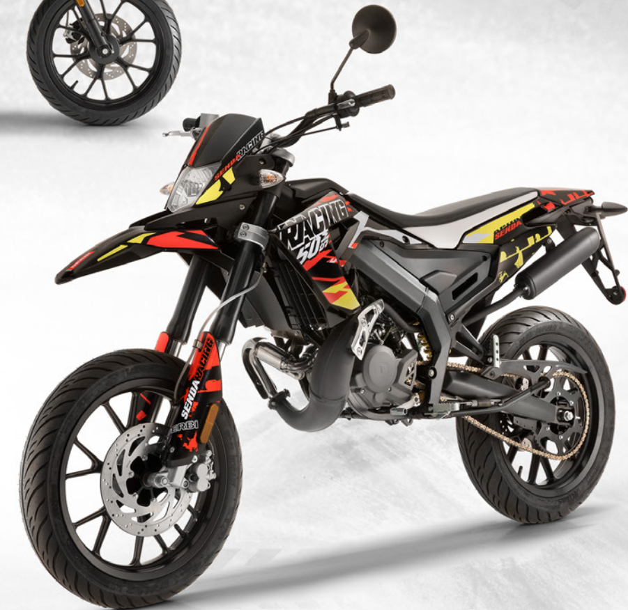
Senda Racing 50 SM