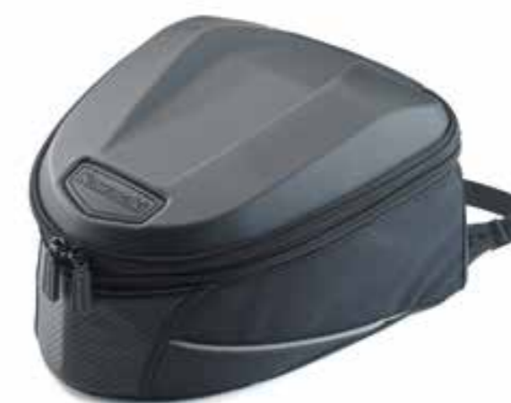
BORSA POSTERIORE MORBIDA