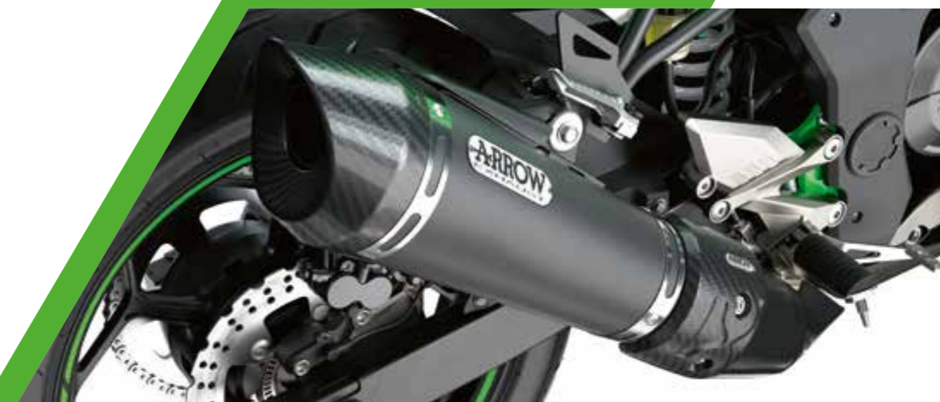
SCARICO ARROW SPORT