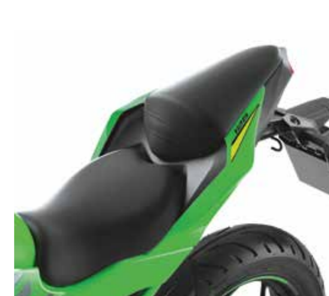
SELLA ALTA ERGO-FIT (+20MM)