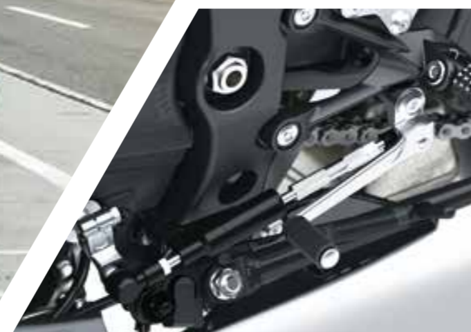
KQS (KAWASAKI QUICK SHIFTER)