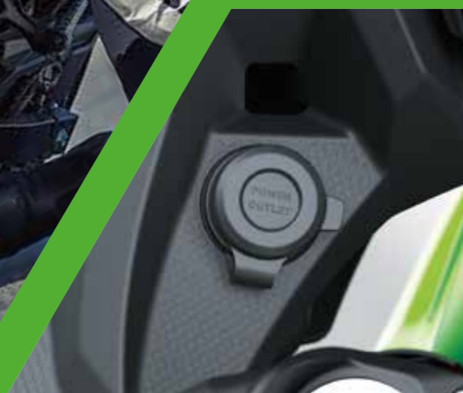
PRESA DI CORRENTE 12V