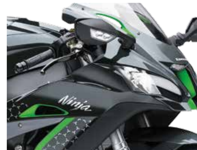
DETTAGLI PARTICOLARI IN VERDE (NINJA ZX-10R SE)