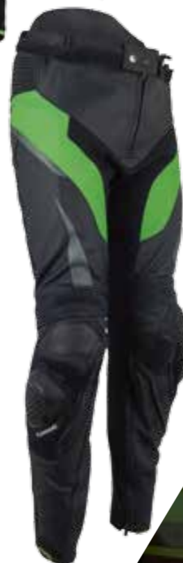
PANTALONI IN PELLE KRT