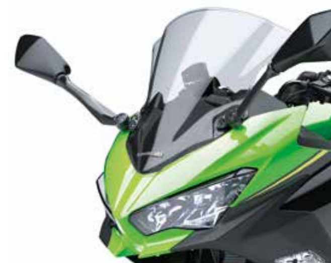
PARABREZZA MAGGIORATO - FUME' O TRASPARENTE