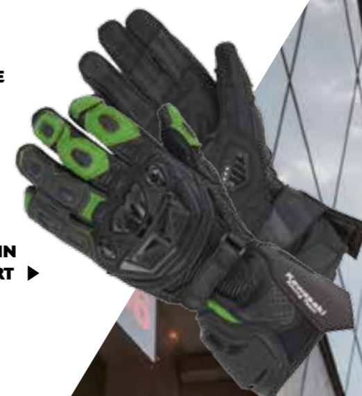
GUANTI IN PELLE KRT