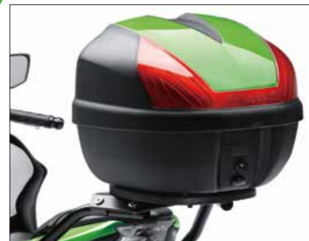
BAULETTO DA 30L