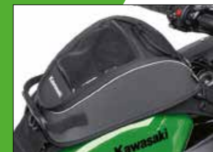
BORSA SERBATOIO DA 4L