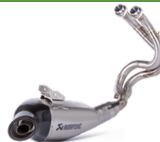
SCARICO AKRAPOVIČ IN TITANIO