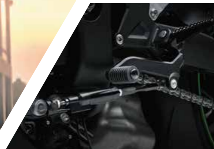
KAWASAKI QUICK SHIFTER BIDIREZIONALE (NINJA ZX-10R SE E RR)