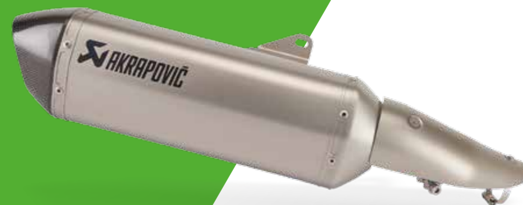
SCARICO AKRAPOVIČ IN TITANIO