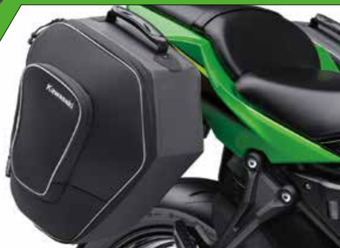
BORSE SEMI-RIGIDE DA 28L