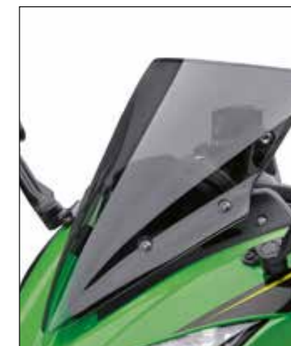
PARABREZZA MAGGIORATO FUMÈ