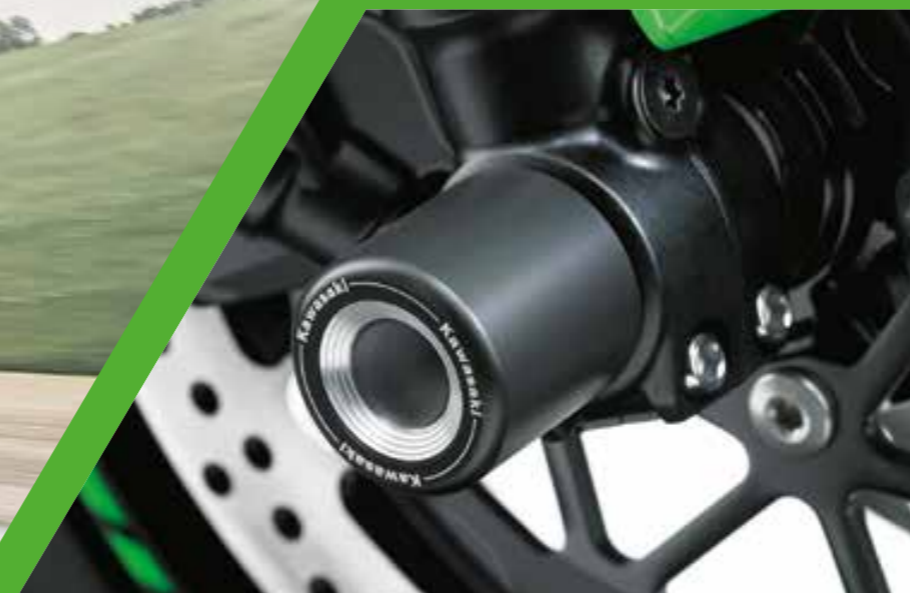
PROTEZIONE PERNO UOTA