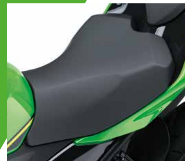
SELLA ALTA ERGO-FIT (+30 MM)