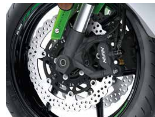
PINZE MONOBLOCCO, DISCHI MAGGIORATI