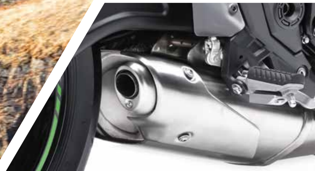
ATTRAENTE SCARICO SOTTO IL MOTORE