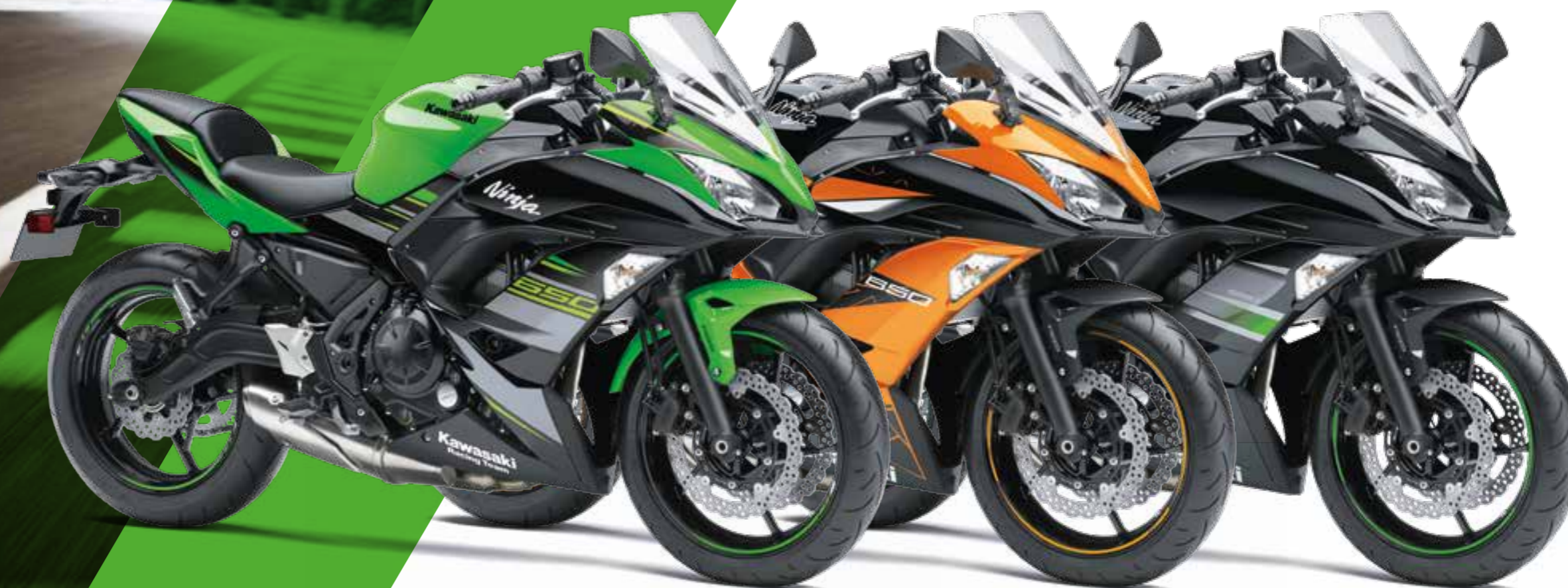
LIME GREEN / EBONY (KRT EDITION)