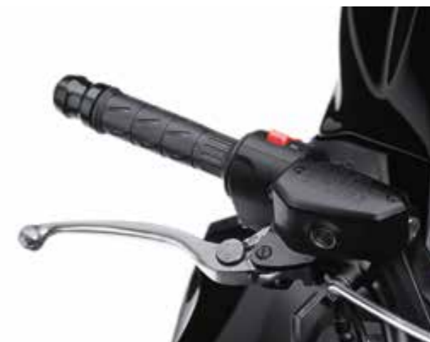
LEVE FRENO E FRIZIONE REGOLABILI SU 5 POSIZIONI