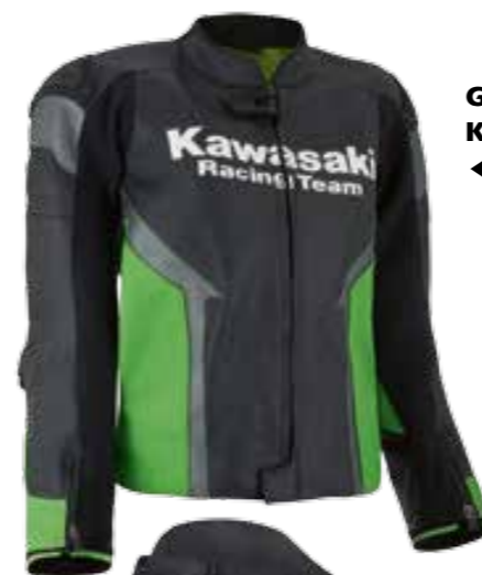
GIACCA IN PELLE KRT

Siate pronti a qualunque situazione con il nostro abbigliamento ufficiale. Realizzato con i migliori materiali, il nostro abbigliamento protettivo non vi deluderà mai. Gamma completa visibile su www.kawasaki.it/it/accessories