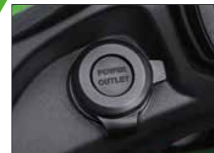
PRESA DI CORRENTE 12V