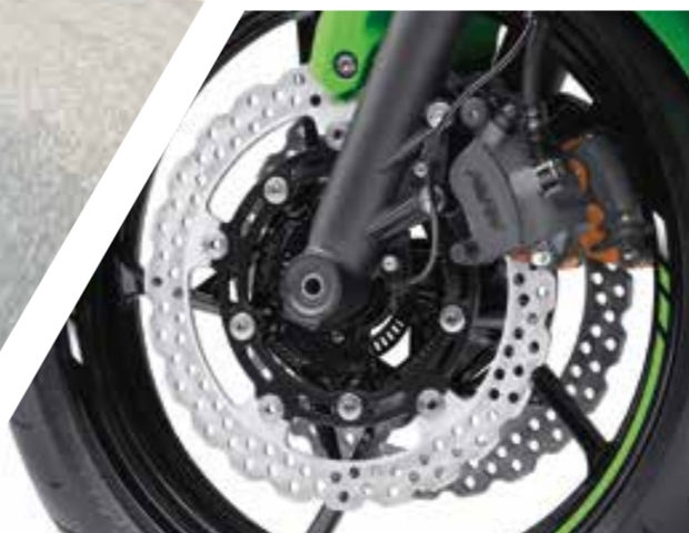
PINZE A 2 PISTONCINI, DISCHI A MARGHERITA