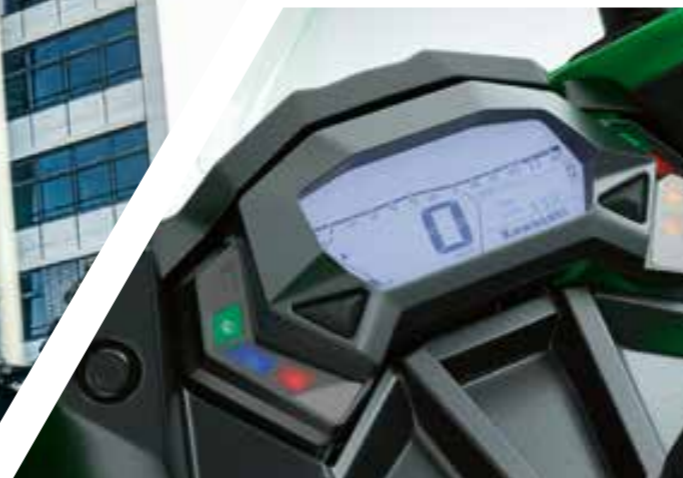
STRUMENTAZIONE COMPLETAMENTE DIGITALE