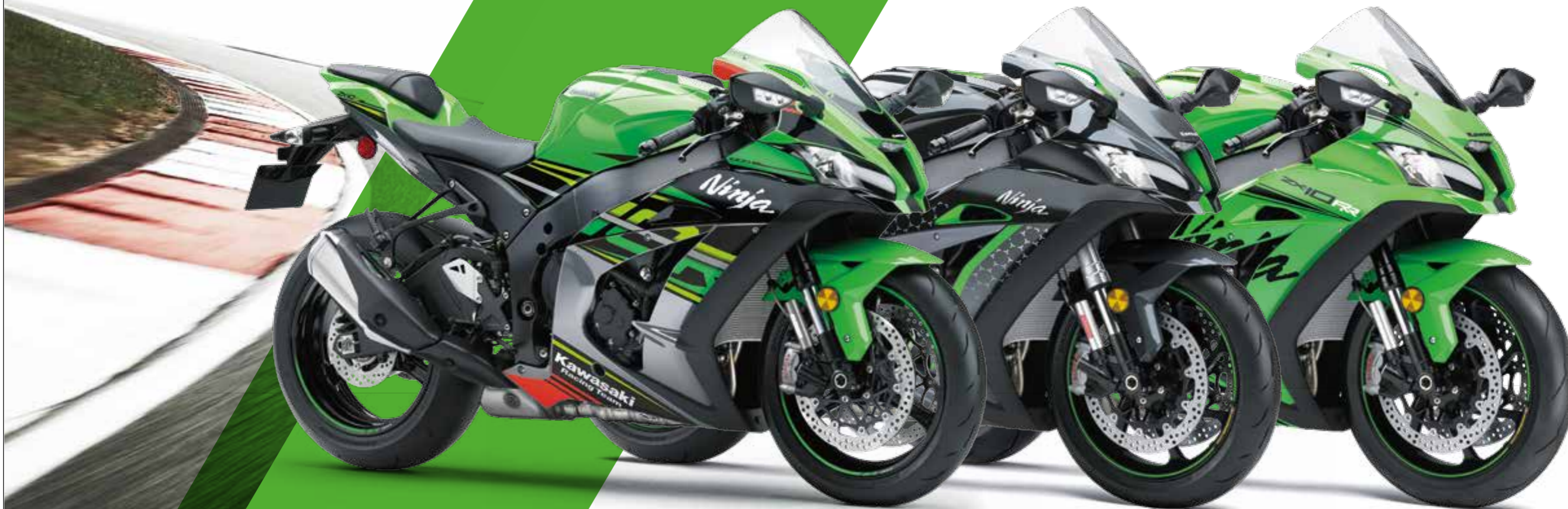
LIME GREEN / EBONY / METALLIC GRAPHITE GRAY (KRT EDITION)