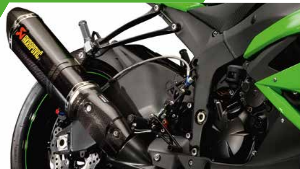
SCARICO AKRAPOVIČ IN CARBONIO