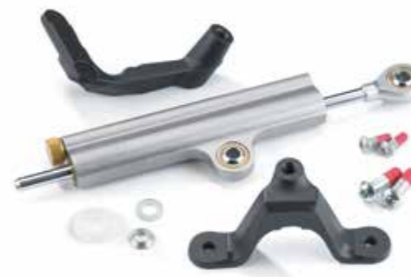
KIT AMMORTIZZATORE DI STERZO