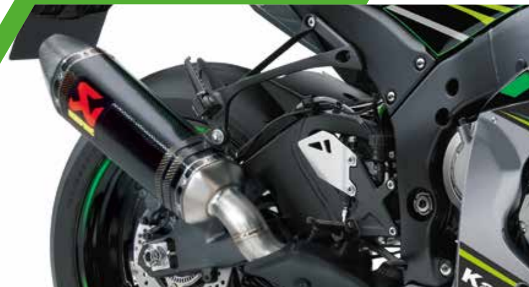
SCARICO IN CARBONIO AKRAPOVIČ