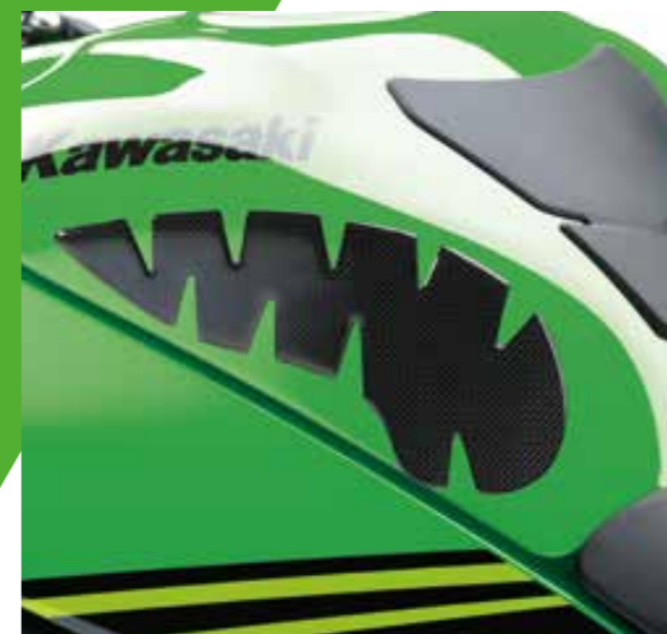
PROTEZIONI LATERALI SERBATOIO