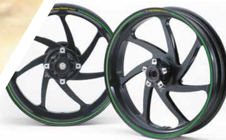
CERCHI FORGIATI MARCHESINI A 7 RAZZE (NINJA ZX-10R SE E RR)