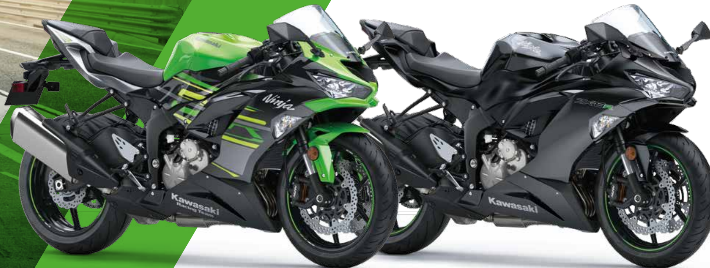
LIME GREEN / EBONY / METALLIC GRAPHITE GRAY (KRT EDITION)