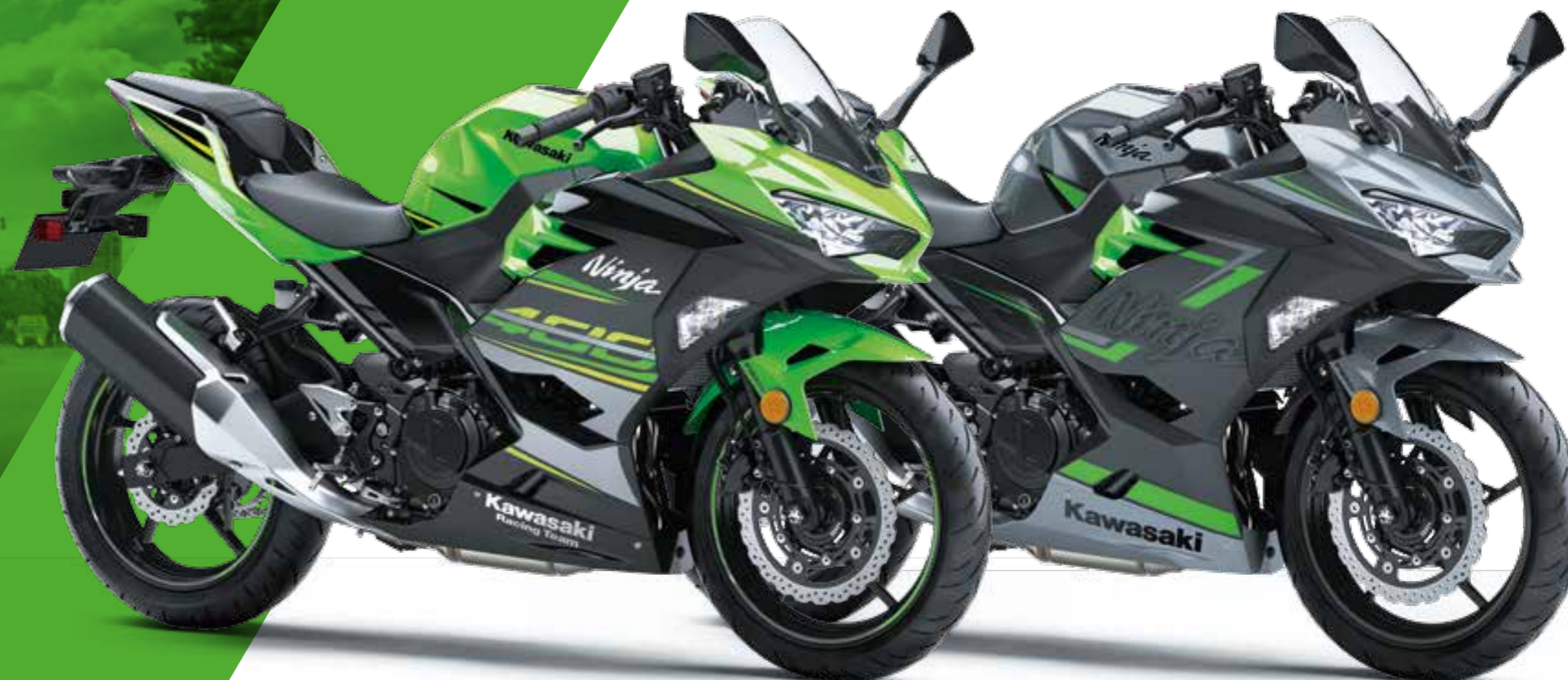
LIME GREEN / EBONY (KRT EDITION)