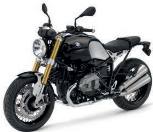
Black Storm metallizzato