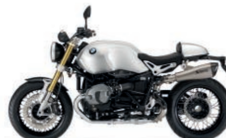
Allestimento con serbatoio con finitura in alluminio spazzolato a vista (optional e accessorio originale), copertura sellino passeggero e sistema di scarico alto Akrapovič (accessori originali)