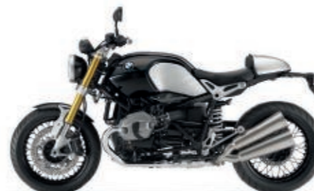
Allestimento monoposto tramite copertura sellino passeggero in alluminio (accessorio originale)