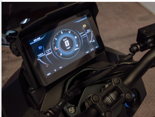
■ Schermo TFT 7" con connettività integrata