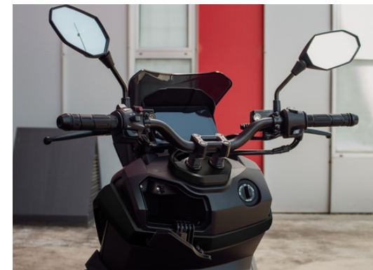
■ Portaoggetti anteriore