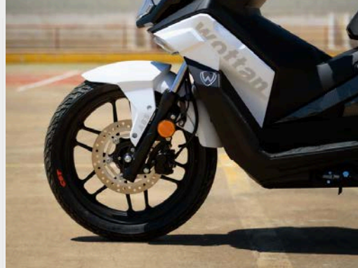
■ ABS a doppio canale