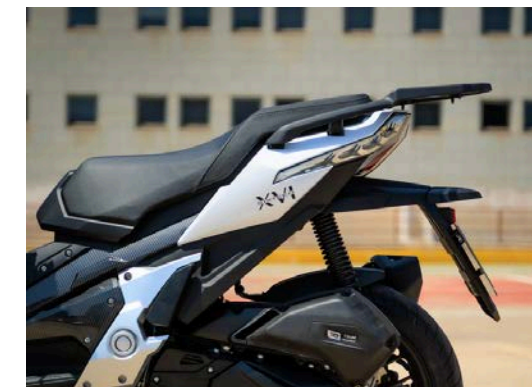
■ Sella a due livelli.