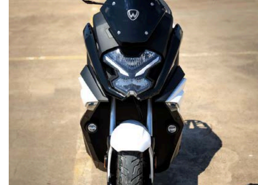
■ Illuminazione FULL-LED