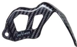
PROTEZIONE PINZA POSTERIORE 69725-50V00-CAR