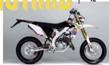
SM 50 BIANCO