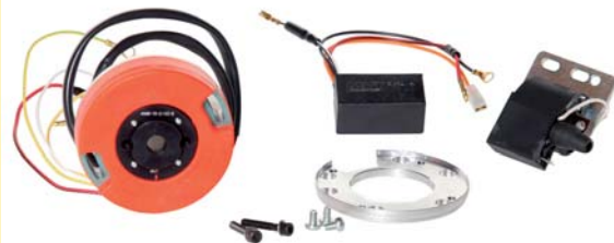
KIT ACCENSIONE 32100-50V00-RAC