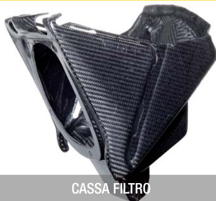
CASSA FILTRO 13700-50V00-CAR