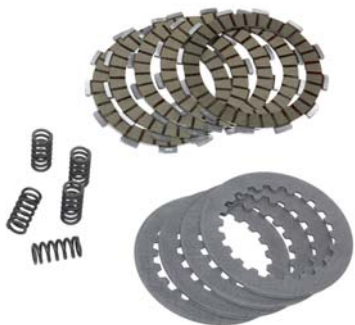
KIT FRIZIONE RACING 21441-50VR0-KIT