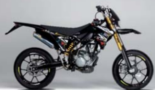
N01 50 NERO