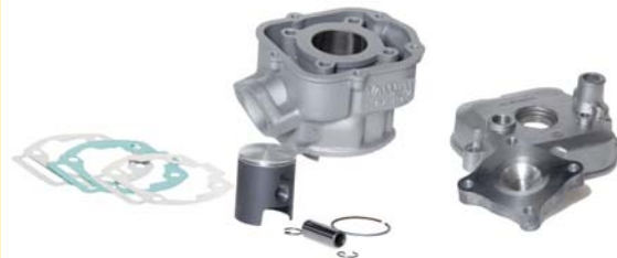
KIT CILINDRO 11200-50V50-RAC