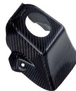
COVER SERBATOIO 53119-50V00-CAR