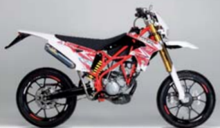
N01 50 ROSSO