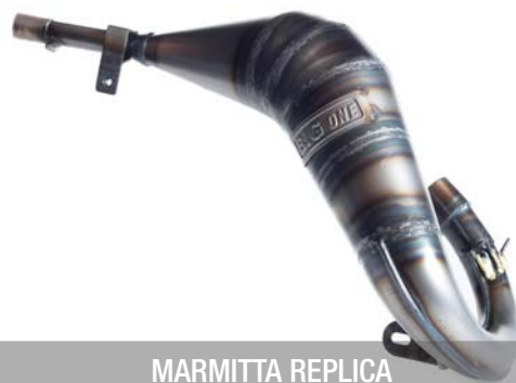
MARMITTA REPLICA 44310-50VR2-000