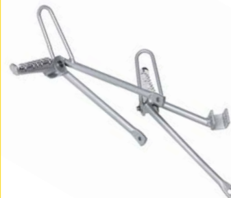
KIT PEDANE PASSEGGERO 43800-50V00-000