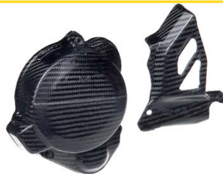
CARTER ACCENSIONE E PIGNONE 11351-50V00-CAR