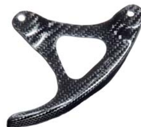
PROTEZIONE DISCO POSTERIORE 69231-50V00-CAR