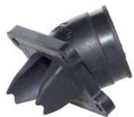
COLLETTORE ASPIRAZIONE 13110-50V28-RAC