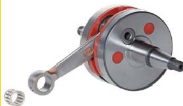
ALBERO MOTORE 12200-50V00-RAC