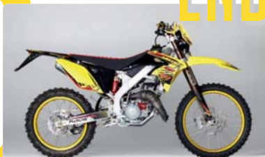
RME 50 RACE