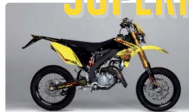
SM 50 GIALLO