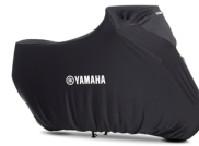
Telo di copertura Yamaha per rimessaggio interno