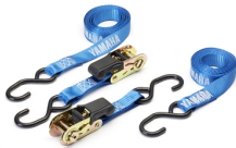
Cinghie con cricchetto Yamaha