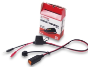
Indicatore caricabatteria YEC