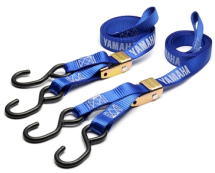
Cinghie con chiusura a fibbia Yamaha