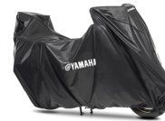
Telo di copertura per modello Yamaha da esterno

Per tutti gli Accessori Novità 2015! WR250F visita il sito www.yamaha-motor.it/accessori oppure un Concessionario Ufficiale Yamaha.