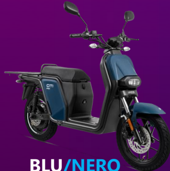
BLU/NERO non a stock