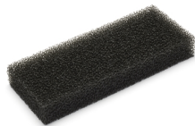
Schiuma per piastra protettiva