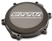
Carter copri frizione in alluminio ricavato dal pieno GYTR®