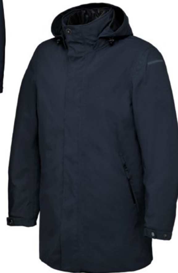
PIAGGIO PARKA ▶