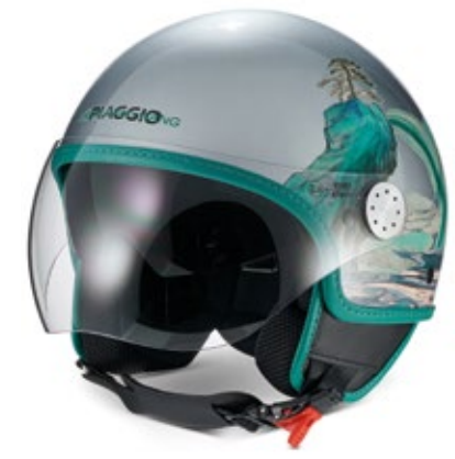
CASCO FENG ▶