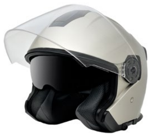
▲ CASCO MODULARE