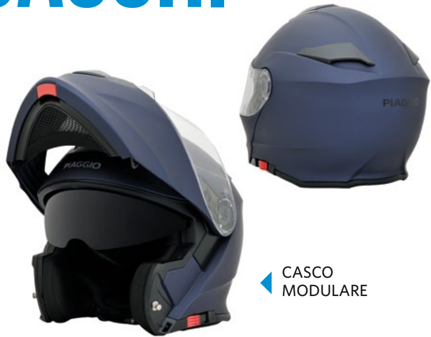
◀ CASCO MODULARE