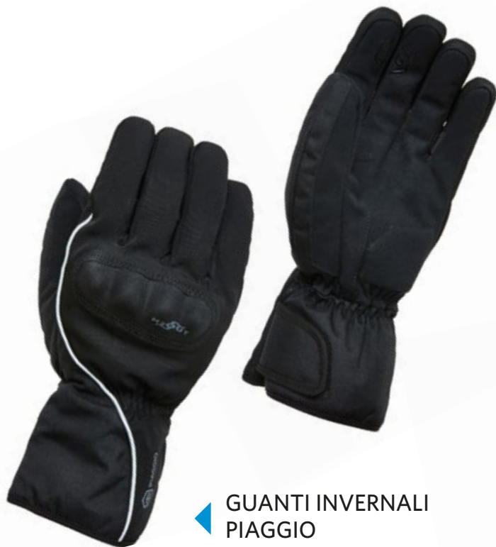
◀ GUANTI INVERNALI PIAGGIO