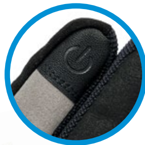
GUANTI TOUCH PIAGGIO