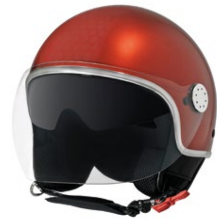
◀ CASCO PIAGGIO MIRROR BT