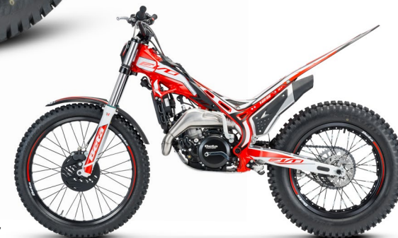
EVO 2T 125

125 2T: La più piccola delle moto omologabili della gamma. Leggera e maneggevole è adatta ai giovani piloti che provengono dalle classi inferiori e si avvicinano alle competizioni "da grandi". / 125 2T: The smallest homologation-ready bike in the range. Light and agile, this is perfect for young riders moving up from lesser classes and making their first forays into more serious competitions. / 125 2T: La plus petite des motos pouvant être homologuées de la gamme. Léger et maniable, elle convient aux jeunes pilotes venant des classes inférieures et abordant la compétition « comme des grands ». / 125 2T: Das kleinste der homologierbaren Motorräder der Baureihe. Leicht und wendig, ist es für die jungen Fahrer geeignet, die von den unteren Klassen kommen und sich den Rennen „der Großen“ annähern.