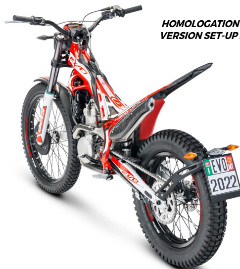
HOMOLOGATION VERSION SET-UP 2T/4T