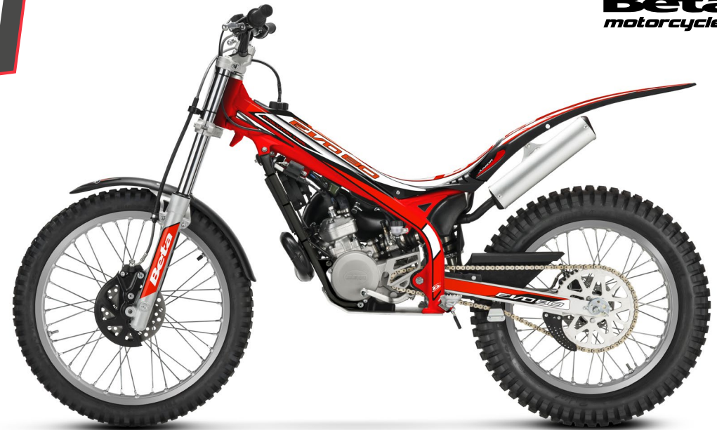
EVO 80 JUNIOR