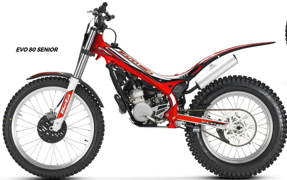
EVO 80 SENIOR