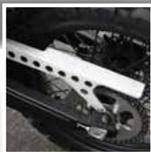
PROTECTION CHAÎNE EN ALUMINIUM PROTEZIONE CATENA IN ALLUMINIO