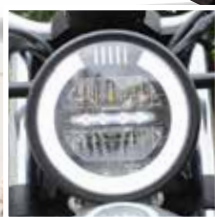
FEU LED FARO A LED