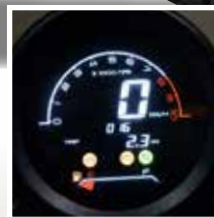
TABLEAU DE BORD LCD TACHIMETRO LCD