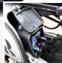
TROUSSE A OUTILS SET ATTREZZI