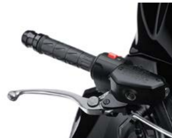
LEVE FRENO E FRIZIONE REGOLABILI SU 5 POSIZIONI