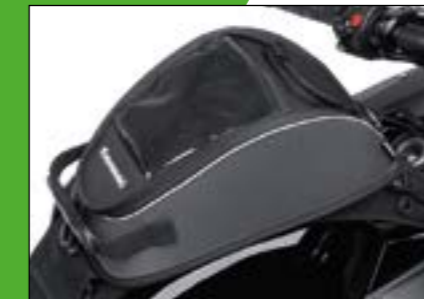
BORSA SERBATOIO DA 4L