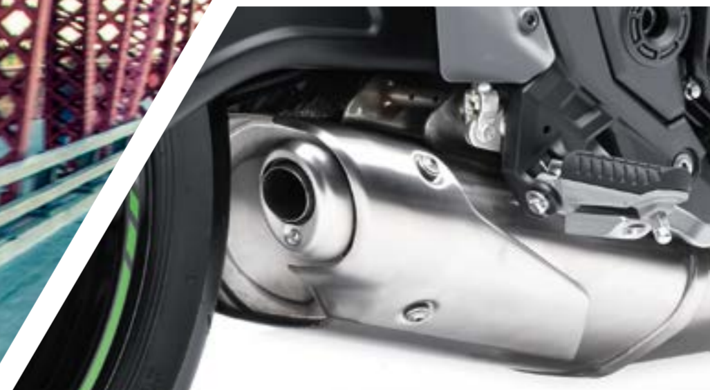
ATTRAENTE SCARICO SOTTO IL MOTORE