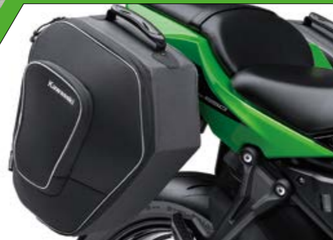
VALIGIE SEMIRIGIDE DA 28L