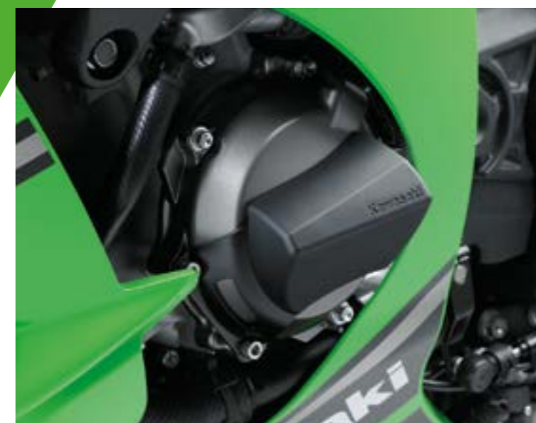
PROTEZIONI CARTER MOTORE