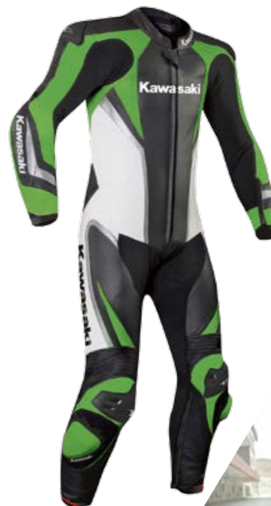
TUTA DI PELLE ▲

Siate pronti per qualunque situazione con la nostra elegante gamma di abbigliamento. Realizzato con materiali della miglior qualità, il nostro robustissimo abbigliamento non vi deluderà. La gamma è visibile sul sito www.kawasaki.it/it/accessories