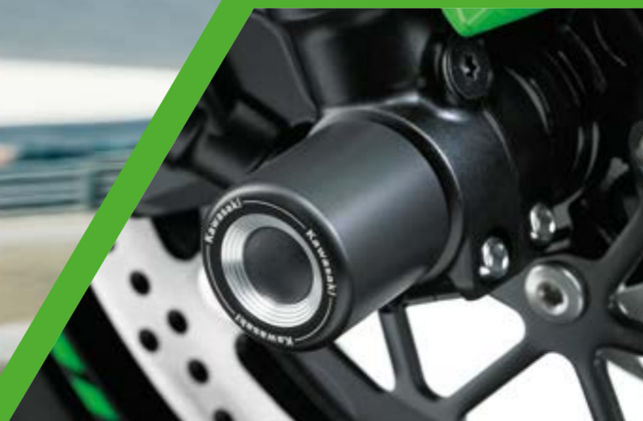
PROTEZIONE PERNO ANTERIORE