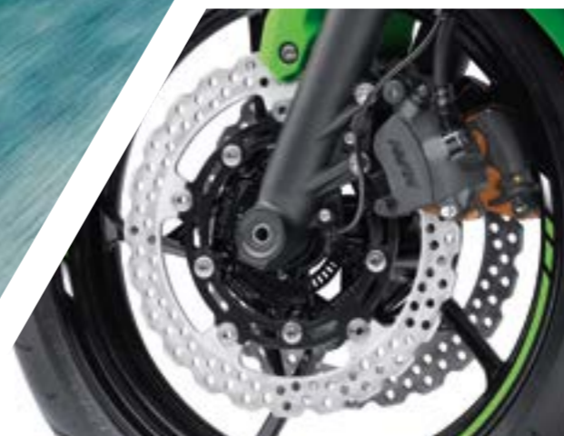
PINZE A 2 PISTONCINI, DISCHI A MARGHERITA