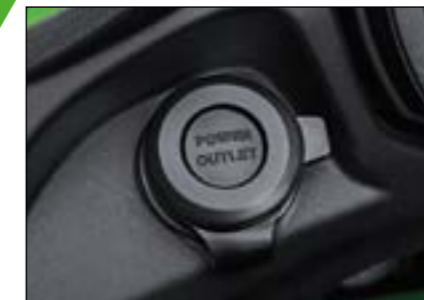
PRESA CORRENTE 12V