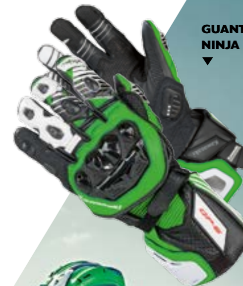
GUANTI IN PELLE NINJA ▼