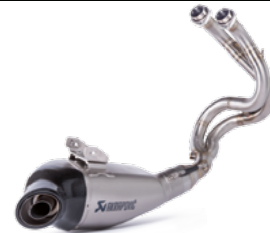
SCARICO IN TITANIO AKRAPOVIČ