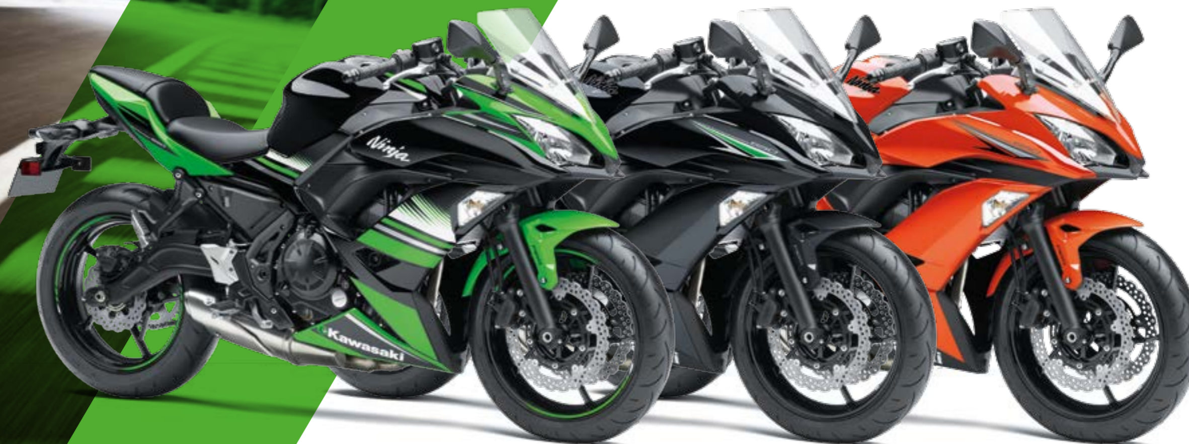
LIME GREEN / EBONY