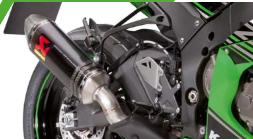
SCARICO AKRAPOVIČ IN CARBONIO