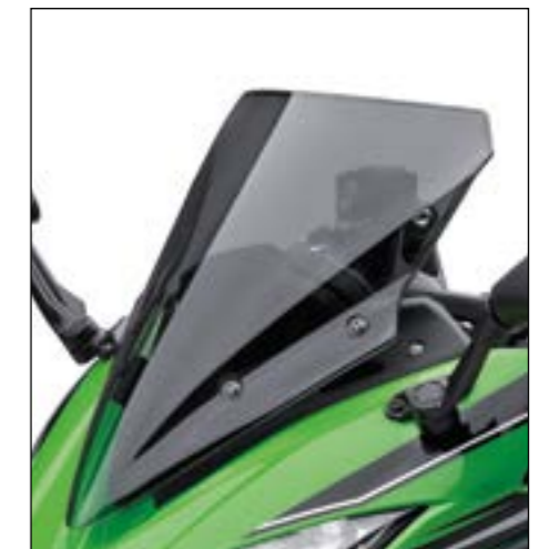
PARABREZZA MAGGIORATO FUMÈ