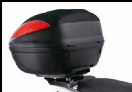
BAULETTO (47 L.)

Portate più bagagli con questo bauletto impermeabile nei colori di serie. Comodo e dotato di serratura, è un vero must in città.*