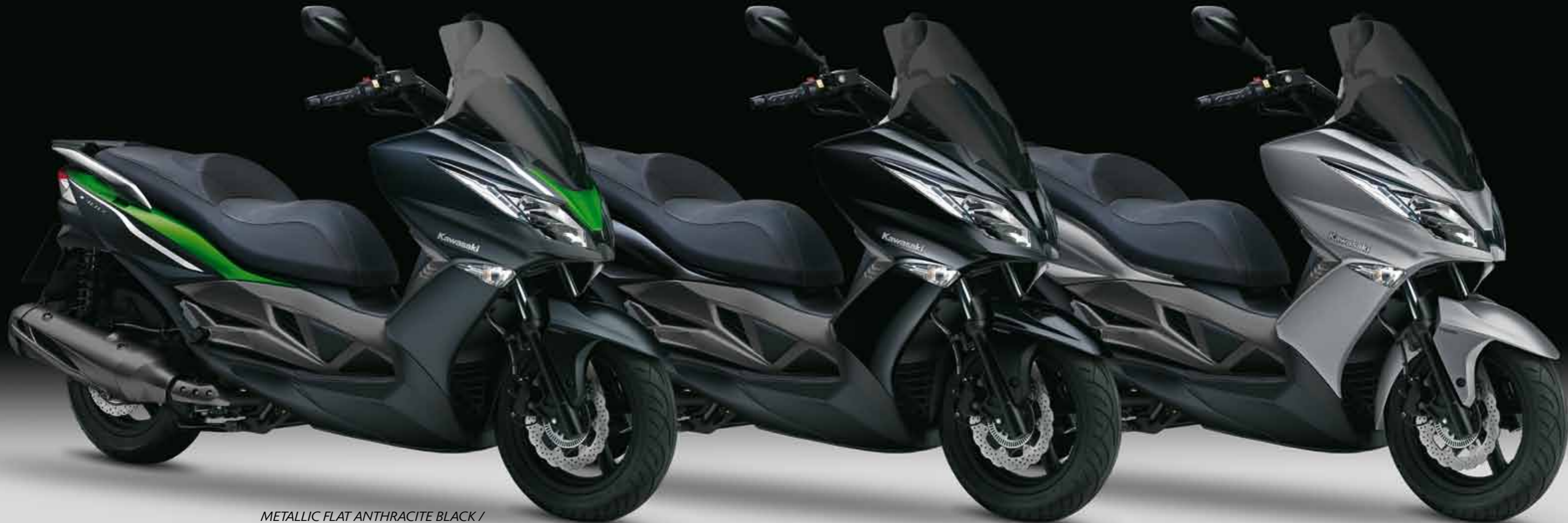
METALLIC FLAT ANTHRACITE BLACK / CANDY FLAT BLAZED GREEN*