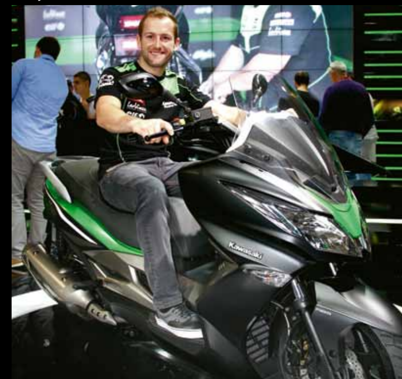
Tom Sykes - Milano Motorshow EICMA 2013