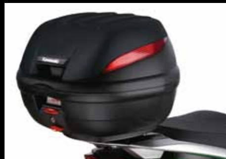
BAULETTO (39 L.)

Portate più bagagli con questo bauletto impermeabile nei colori di serie. Comodo e dotato di serratura, è un vero must in città.*