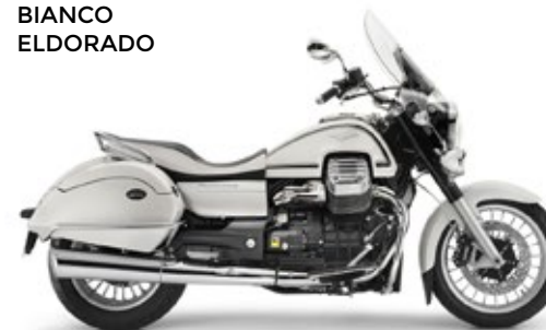
● BIANCO ● ELDORADO ● ● ● ● ●