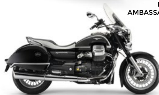
● NERO ● AMBASSADOR ● ● ● ● ●

California 1400 Touring è una pietra miliare nella storia di Moto Guzzi. Eletta l'Ammiraglia delle Granturismo da alcune prestigiose testate specializzate, è il punto di riferimento indiscusso nel suo comparto. Abbina linee di design evocative della sua prestigiosa tradizione a un livello di tecnicità che fa scuola.