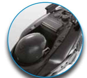
L'ampio vano sottosella può contenere un casco integrale