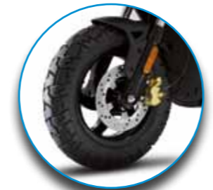
Pneumatici da 12" di ampia sezione