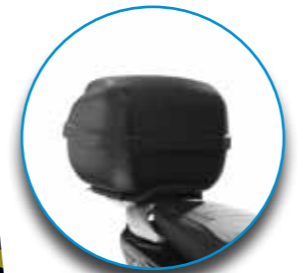
Kit bauletto nero gofrato