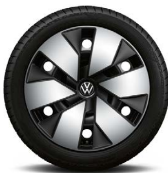
Di serie con Bi-color Exterior Style Pack

Cerchi in acciaio 7,5J x 18" con pneumatici 215/55 R18 95T