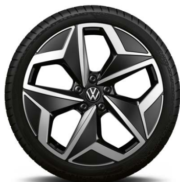
Di serie su Tour

... include bulloni ruote con sistema antifurto