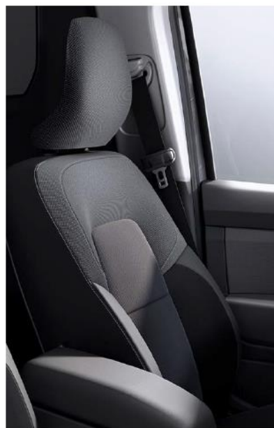
sellerie rinforzate per uso intensivo