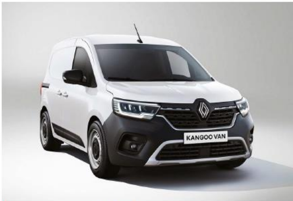
bianco minerale (O)