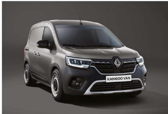
grigio cassiopea (M)