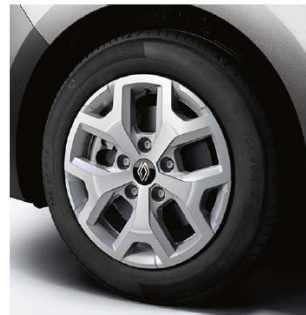
cerchi in alluminio da 16'' PURNA