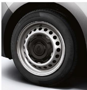
cerchi da 16'' CARTEN