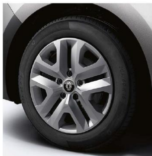
cerchi da 16'' LIMAN