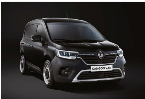
nero étoilé (M)