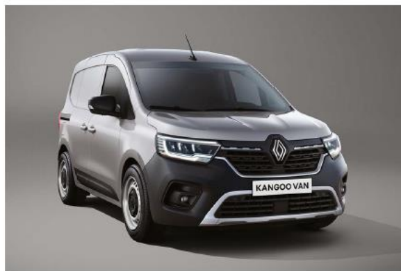
grigio magnete (M)