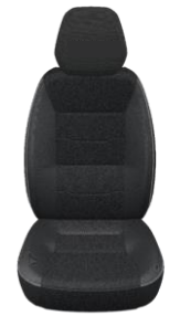
Tessuto Crepe (BUFEX)