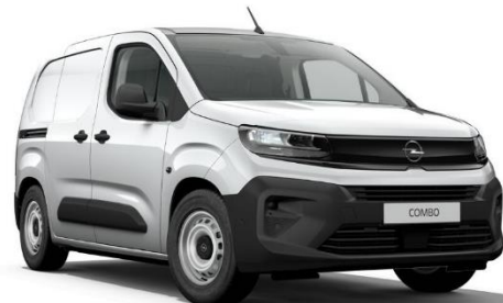
➤ COMBO CARGO