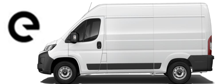
➤ MOVANO Electric AM 10

Cliccare sul nome del modello per andare al listino desiderato