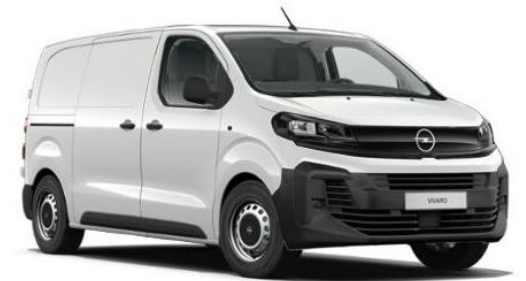
➤ VIVARO VAN / DOPPIA CABINA