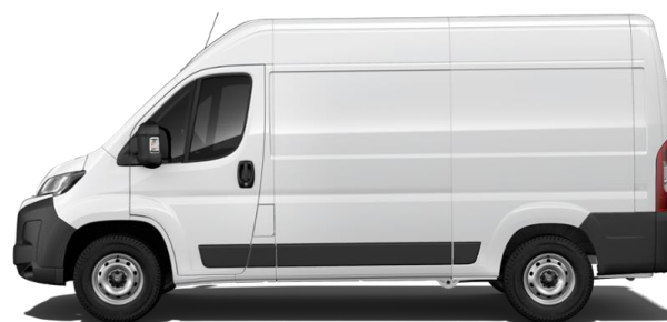
➤ MOVANO AM 10