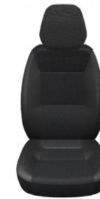
Tessuto Crepe (BTFX)