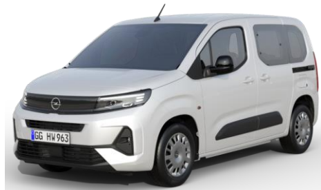
➤ COMBO LIFE N1