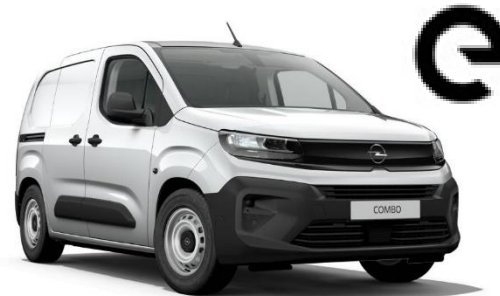
➤ COMBO CARGO Electric