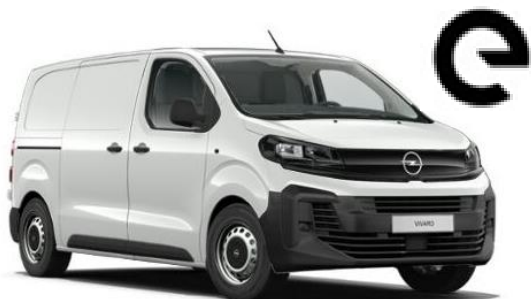
➤ NUOVO VIVARO Electric