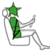
Conducente in impatto laterale