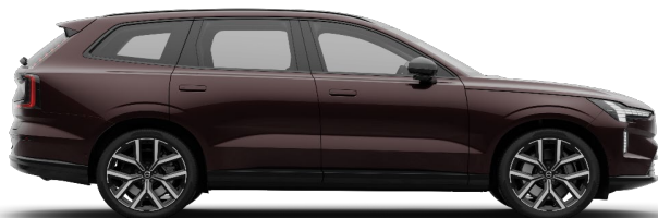
739 Mulberry Red