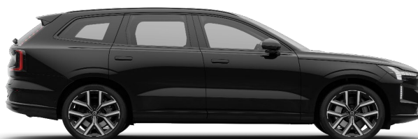
717 Onyx Black