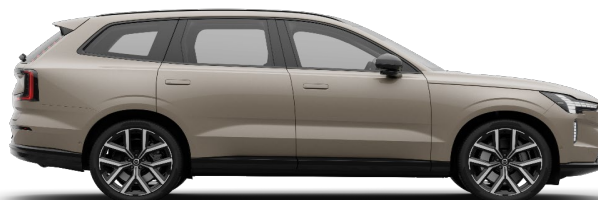
743 Sand Dune