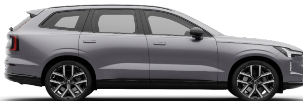
745 Aurora Silver