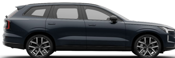
723 Denim Blue