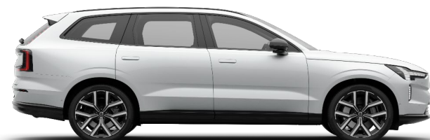
707 Crystal White