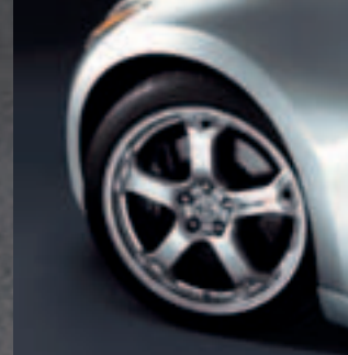
Cerchi in lega da 19"