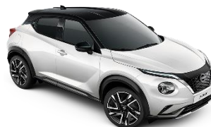
WHITE PEARL BRILLIANT /BLACK