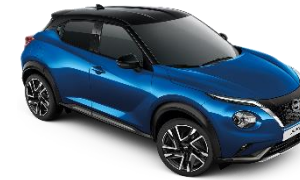
MAGNETIC BLUE /BLACK