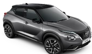
DARK METAL GREY /BLACK