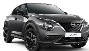
DARK METAL GREY