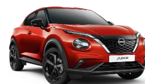
FUJI SUNSET RED