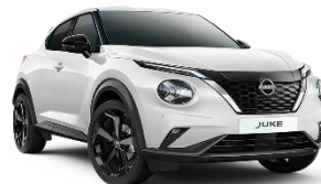
WHITE PEARL BRILLIANT