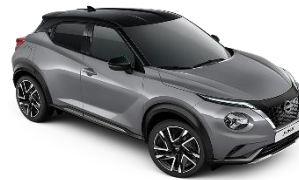
CERAMIC GREY /BLACK