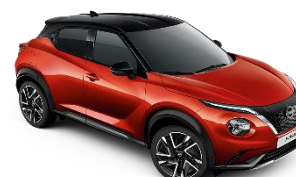
FUJI SUNSET RED /BLACK