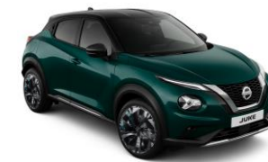
DEEP OCEAN/ BLACK