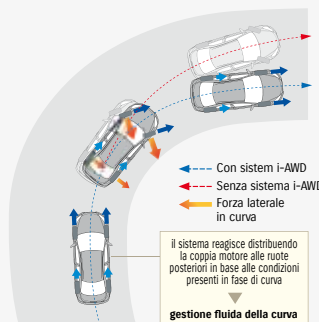
Curve prestazioni motore