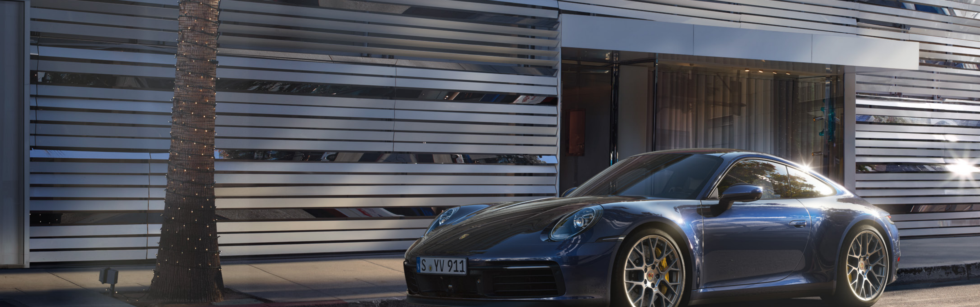
911 Carrera 4S