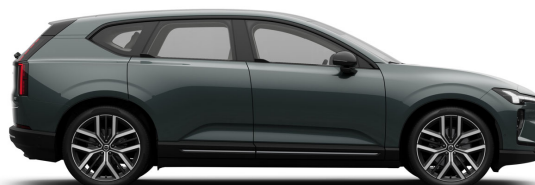
746 Forest Lake