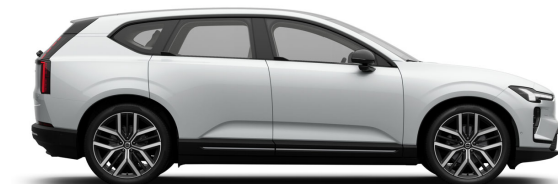
707 Crystal White