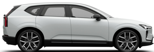
614 Ice White