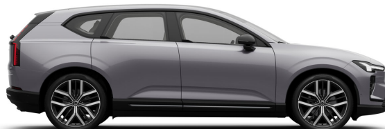
745 Aurora Silver