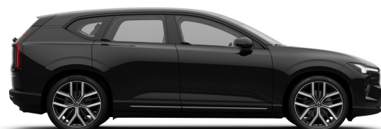
717 Onyx Black