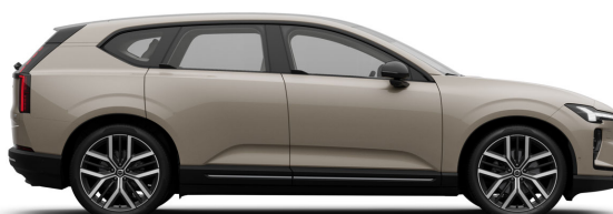
743 Sand Dune