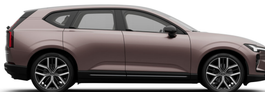
750 Heather Bronze