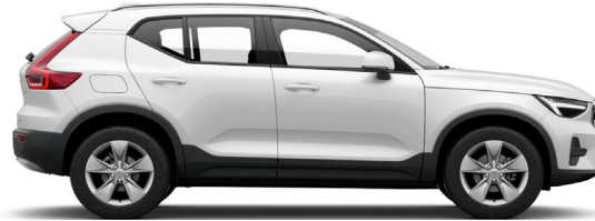
707 Crystal White