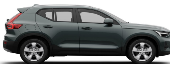
746 Forest Lake