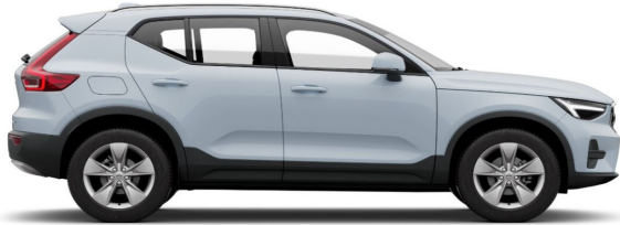
626 Cloud Blue