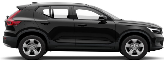
717 Onyx Black