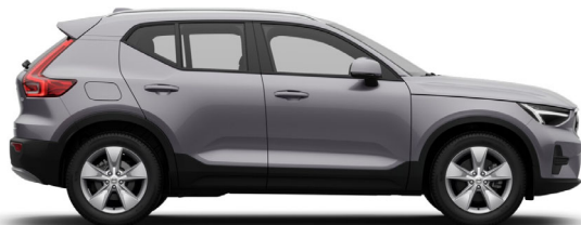
745 Aurora Silver