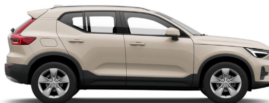
743 Sand Dune