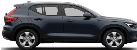
723 Denim Blue