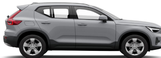
740 Vapour Grey