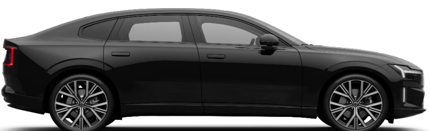
717 Onyx Black