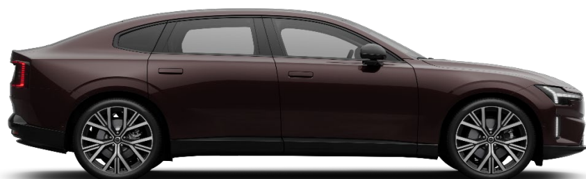
739 Mulberry Red