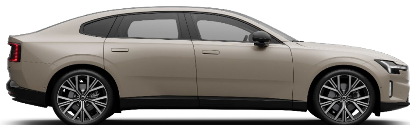
743 Sand Dune