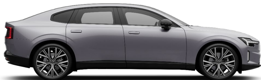
745 Aurora Silver