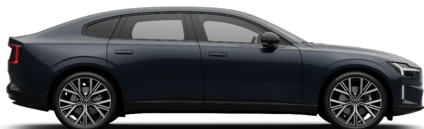
723 Denim Blue