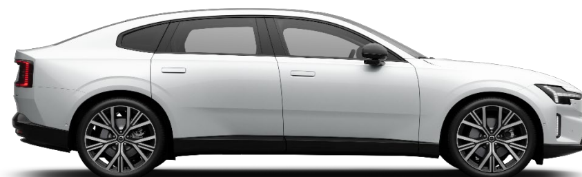
707 Crystal White