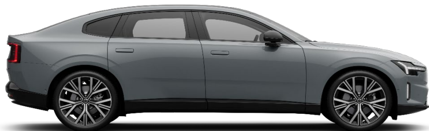
740 Vapour Grey