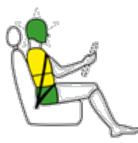
Conducente in impatto laterale