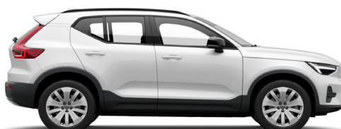
707 Crystal White