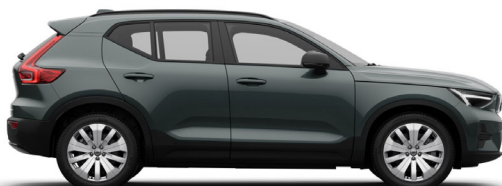
746 Forest Lake