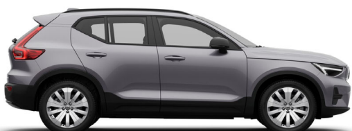
745 Aurora Silver