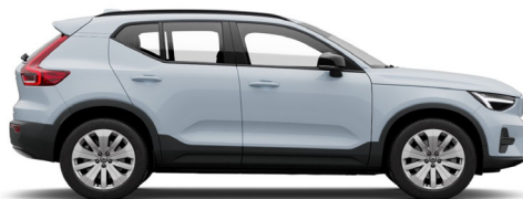
626 Cloud Blue