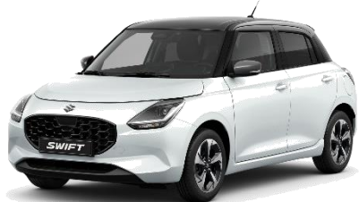
Bianco Artico / Grigio