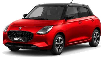
Rosso Cordoba / Nero