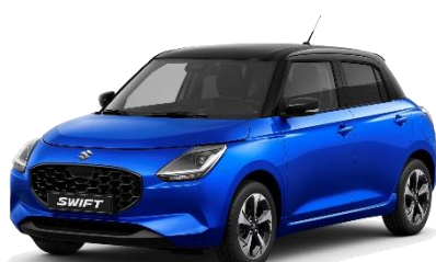
Blu Oceania / Nero