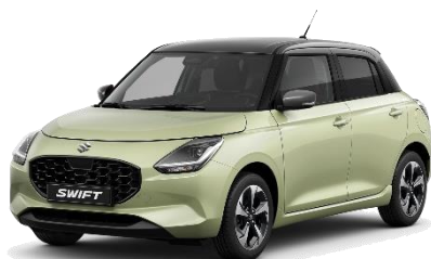
Verde Hawaii / Grigio