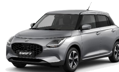
Argento New York