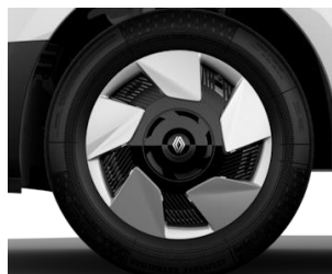
cerchi da 17" Bitono