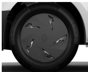
cerchi da 17" Noir