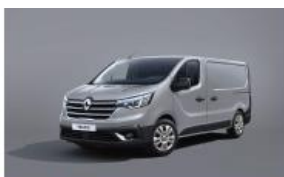
grigio magnete (vm)