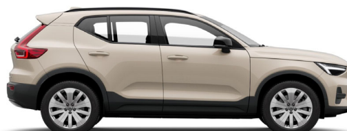
743 Sand Dune