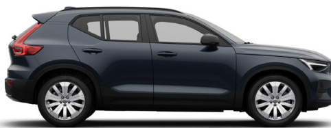
723 Denim Blue