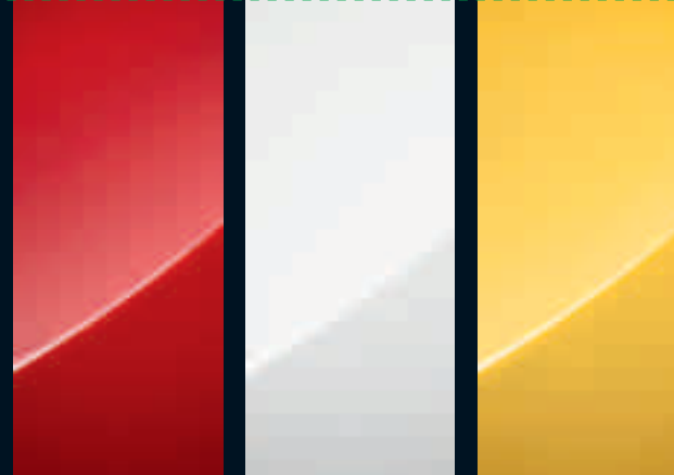
Power Red (Brilliant)

Dal rosso brillante al nero metallico, i colori di Astra GTC sono carichi di energia e trasmettono tutta la sua grinta e sportività.