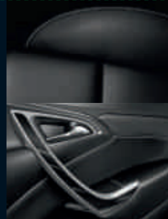
Sedili ergonomic sportivi': Pelle Mondial, Jet Black Finiture: Brushed Titanium Light/ Piano Structured