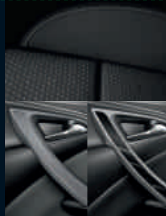
Sedili ergonomic sportivi': Lace/Atlantis, Jet Black Finiture: a seconda della versione