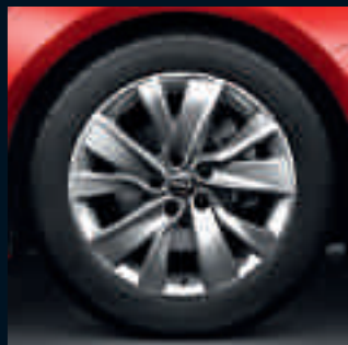
Cerchio in lega da 7,5J x 18" Elegant, pneumatici 235/50 R 18. Opzionale su Elective.