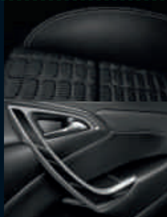
Cosmo/Cosmo S: Imola/Morrocana, Jet Black Finiture: Brushed Titanium Light/ Piano Structured