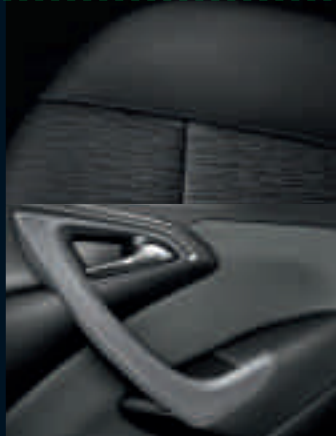
Elective: Silvanus/Atlantis, Jet Black Finiture: Dolomite Pearl Light