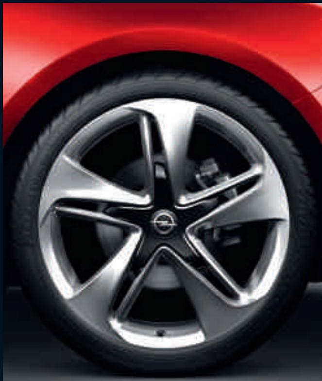
Cerchio in lega da 8,5J x 20" Iconic, pneumatici 245/40 R 20. Opzionale su Cosmo S.

Un'esclusiva gamma di efficienti motorizzazioni, di attraenti cerchi in lega e di sofisticati equipaggiamenti a richiesta permettono di personalizzare la vettura secondo il proprio gusto.