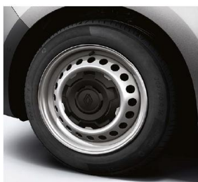
cerchi da 16" CARTEN