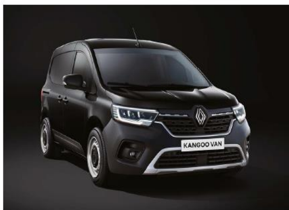
nero étoilé (M)