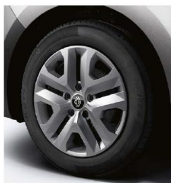
cerchi da 16" LIMAN