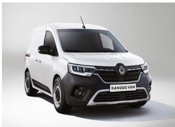
bianco minerale (O)