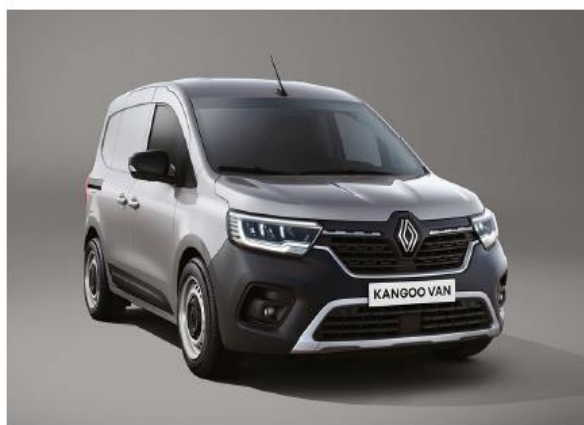
grigio magnete (M)