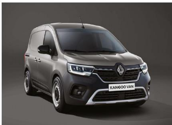
grigio cassiopea (M)